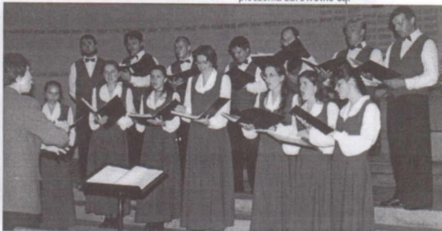
„ANIMATO” w NIEMCZECH (str. 2)