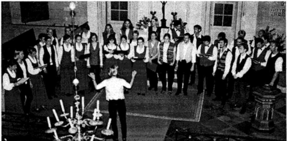
Występ „Animato” wspólnie z gospodarzami

Rada Gminy i Zarząd Gminy pracują na oczach wszystkich mieszkańców i wyborców. Co zamierzamy robić w najbliższych latach - o tym powszechnie mówimy i to powszechnie ogłaszamy. Głównymi celami są: szybki rozwój w każdej dziedzinie życia, tworzenie warunków równych europejskim standardom, zapewnienie pracy możliwie wszystkim potrzebującym, a młodzieży danie wykształcenia na miarę wymagań XXI wieku.