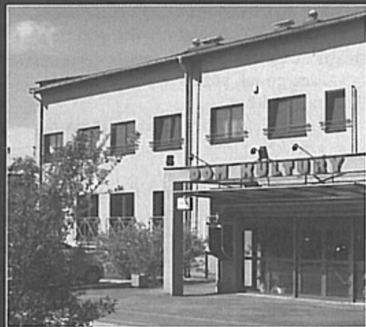
... tak jest.