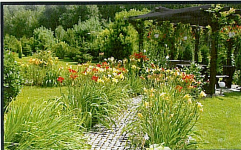
Najpiękniejszy ogródek gminy Pawłowice w tym roku należy do Stanisławy i Stanisława Pabichów z Pięgrzymowic.