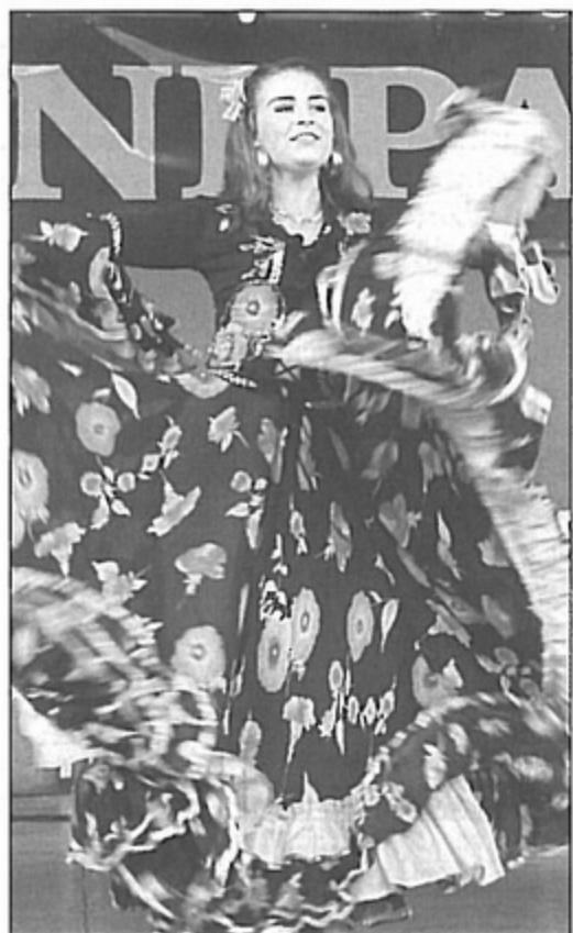
Z okazji jubileuszu zaproszono mieszkańców na wspaniały koncert muzyki cygańskiej.

Była też wystawa zdjęć obrazująca szesnaście lat działalności placówki. Każdy, kto odnalazł się na dawnych fotografiach mógł zabrać je na pamiątkę jubileuszu. Na zakończenie w plenerze wystąpiły zespoły wykonujące muzykę cygańską. Było bardzo kolorowo i tanecznie. bs