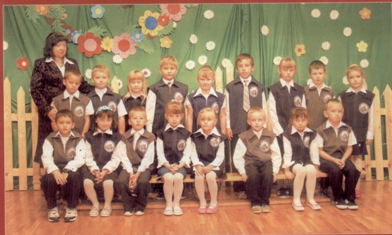
Klasa I B