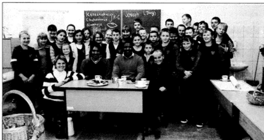
Pamiątkowe zdjęcie lektorów z szóstkoklasistami.

Celem wizyty oprócz lepszego poznania języka angielskiego i sprawdzenia swoich umiejętności w konfrontacji z Anglikiem i Amerykaninem było też przełamanie pewnych stereotypów oraz barier w kontaktach z obcokrajowcami. bs