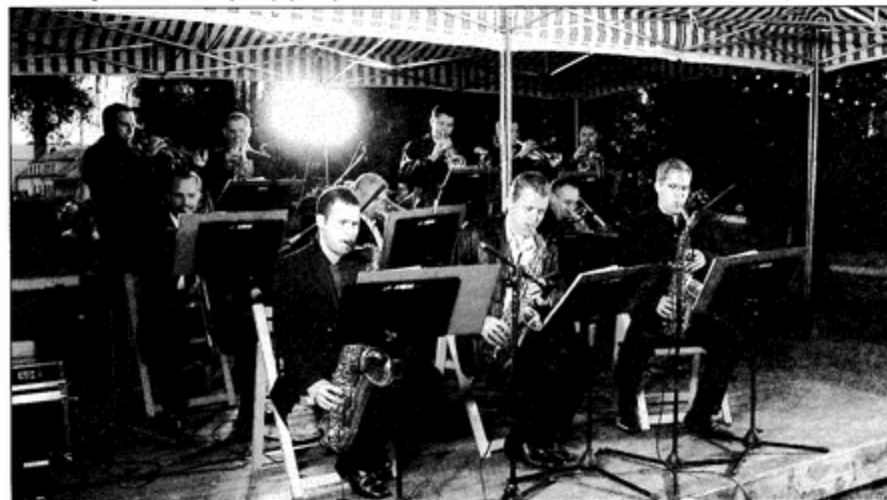
Big Band KWK Pniówek po raz ostatni w tym roku zagrał w pawłowickim parku.