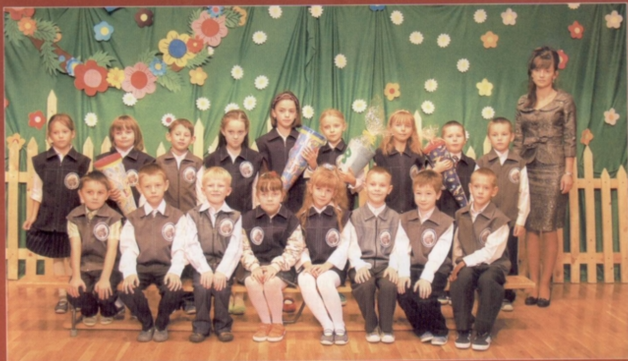
Klasa I A