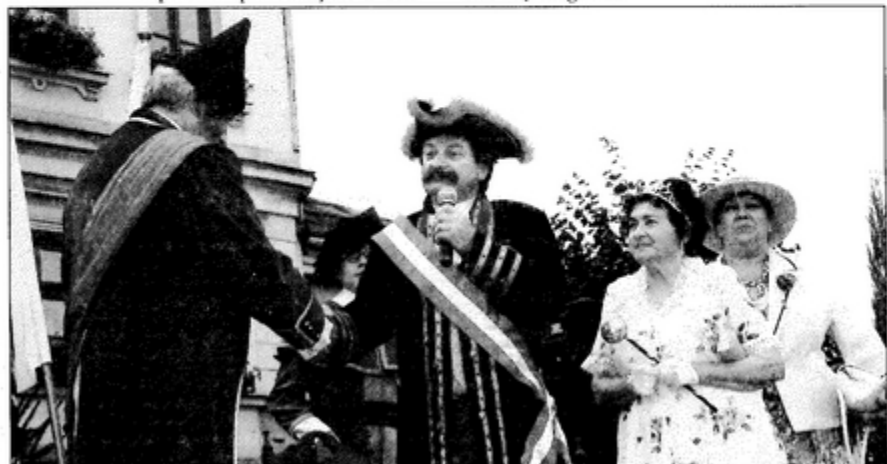
Król Prus wita się z cesarzem Austro-Węgier.

licznych miejscowości. Wśród wielu grup śpiewających zaprezentował się także pawłowicki zespół Talizman. Jego występ tak się spodobał, że zespół już został zaproszony na kolejną imprezę w 2009 roku. Będą ona nawiązywać do 90. rocznicy I Powstania Śląskiego. bs