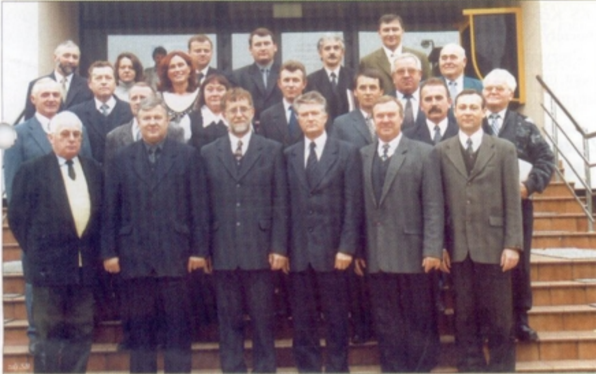
W takim składzie Rada Gminy spotkała się po raz ostatni.

10 października 24-osobowa Rada Gminy spotkała się po raz ostatni. Tego dnia o godz. 24.00 kadencja obecnych radnych zbliżyła się do końca. Nadszedł za to czas na podsumowanie jej działalności i pierwsze oceny.