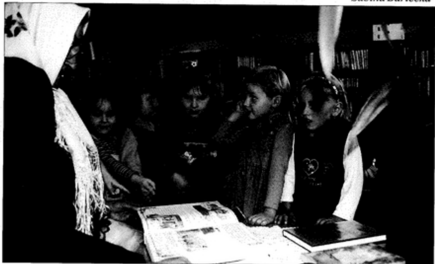
Przedszkolaki z zainteresowaniem wysłuchały bajek