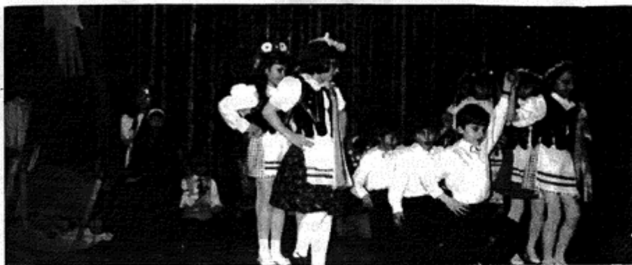
To tylko mały fragmencik wielkiego dnia w Pielgrzymowicach