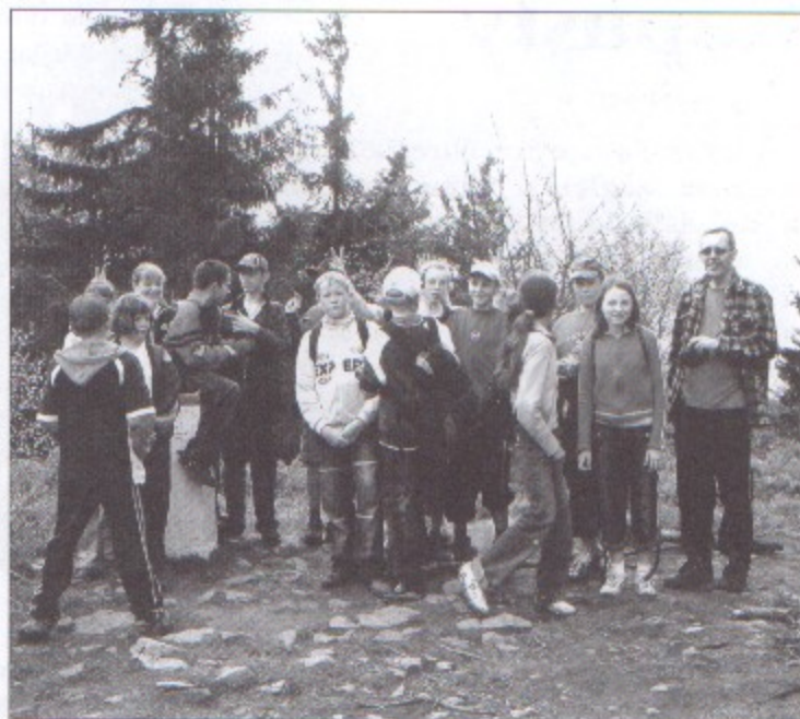
Nowy dyrektor szkoły w Krzyżowicach wraz z uczniami na wycieczce w góry.