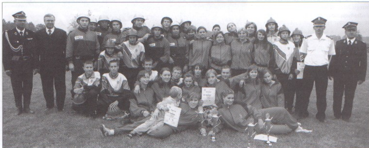
Pamiątkowe zdjęcie strażaków z Pawłowic, którzy wygrali zawody we wszystkich czterech kategoriach.