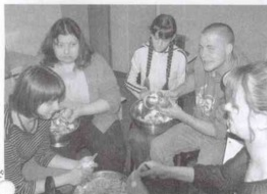
Tak powstawały dobre powidła z jabłek.

Słowa uznania należy skierować do Stowarzyszenia Kulturalno Społeczne Karola Miarki z Pielgrzymowic, za energię, zapał i pomysłowość w realizacji programu pobytu w gminie delegacji miast partnerskich z Ve-