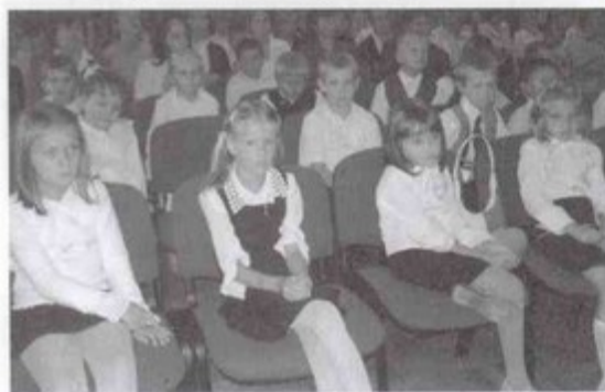
Odświętnie ubrane pierwszaki czekające na moment wstąpienia do grona uczniów.

Wakacje się skończyły. Plecaki ze stelażem wylądowały na dnie szaf, a w ich miejsce pojawiły się te mniejsze, przeznaczone na książki i przybory szkolne. Z wakacyjnych wojaży pozostały jedynie wspomnienia, a nadszedł czas mozolnej nauki i zaliczania kolejnych sprawdzianów. Sądząc po minach uczniów należy stwierdzić, że humory po wakacjach jak najbardziej im dopisują, co jest dobrym prognostykiem na rozpoczynającą się czas nauki. bs