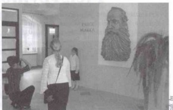
Nowy korytarz szkolny z płaskorzeźbą patrona stał się ulubionym miejscem robienia pamiątkowych fotografii.