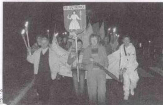
ocny marsz z pochodniami.

Prawdziwy egzamin z serdeczności, gościnności i dobrej organizacji przeszli mieszkańcy Pielgrzymowic, organizując od 27 sierpnia do 3 września międzynarodowy projekt, pt. „Artystyczna tęcza – kultura buduje obywatelską Europę”, współfinansowany przez Komisję Europejską.