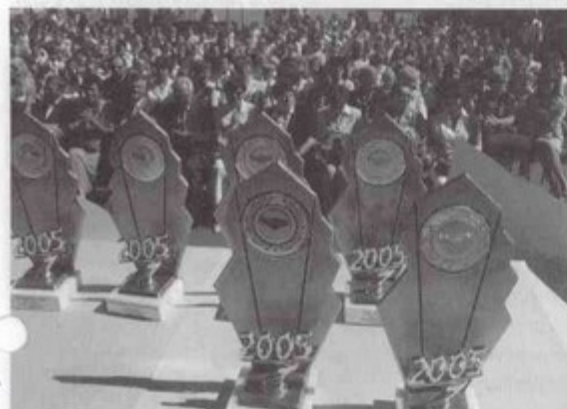
Specjalne statuetki, ustanowione z okazji jubileuszu szkoły, wręczono dziewiętnastu osobom.