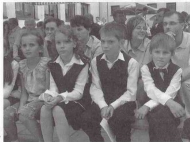
W programie festynu znalazły się występy dzieci szkolnych.

Przez stulecia Krzyżowice stanowiły własność książąt pszczyńskich, którzy jednak nie zarządzali nimi bezpośrednio, ale czynili to poprzez dzierżawców, stosujących często nieludzki wyzysk. Byli oni za to zienawidzeni przez miejscowych chłopów. W 1811 roku wybuchł bunt, który stał się motywem jedynej, jak na razie, powieści o Krzyżowicach pt. „Zbójnik opiekun”, którą napisał krzyżowiczanie