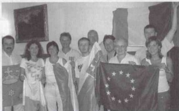
Przedstawiciele grup młodzieży z Austrii, Francji i Słowacji oraz koordynatorzy z Polski.

jeździć na wycieczki do Cieszyna, Krakowa i Ojcowa. Większość zajęć będzie się odbywać pod GOK-iem, aby zachęcić mieszkańców naszej gminy do wzięcia w nich udziału. W sobotę pierwszego października o godzinie 14.00 odbędzie się happening pod