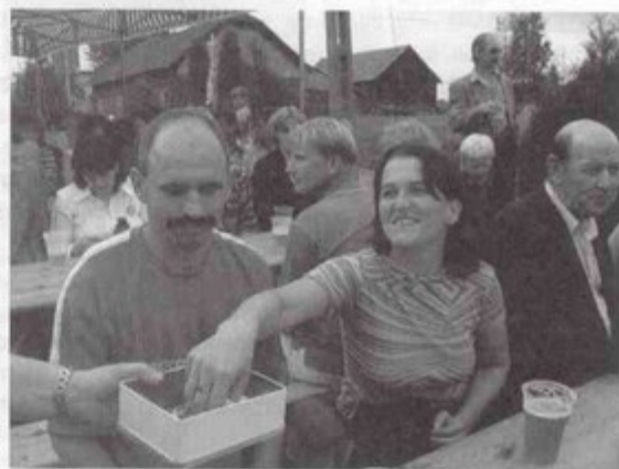
Na losy loterii fantowej znalazło się wielu chętnych.

Dochód z organizacji imprezy Koło chce przeznaczyć na ognisko oraz potańcówkę dla swoich członkiń i ich rodzin. Organizacja biesiady to świetny pomysł na to, aby zarobić jakieś pieniądze, a