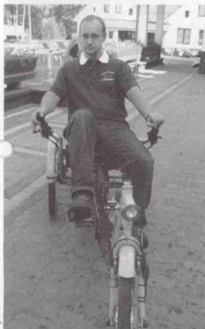
Rower rehabilitacyjny dla niepełnosprawnych.

Próbuje temu zaradzić Fundacja Aktywnej Rehabilitacji działająca w Polsce od 1988 roku, która wykorzystuje szwedzki model aktywnej rehabilitacji. Fundacja działa na zasadzie wzor-