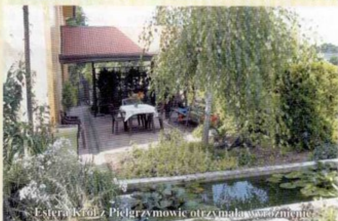
Estera Król z Pielgrzymowic otrzymała wyróżnienie.