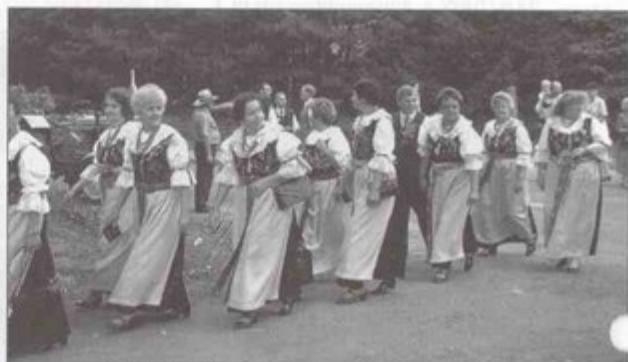
Zespół „Harmonia” z Krzyżowic wziął udział w dożynkowym korowodzie.