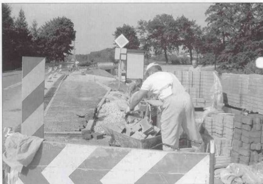
Prace zakończą się lada dzień.

Kiedy jesienią ubiegłego roku oddawano most w Pielgrzymowicach, mieszkańcy tego sołectwa nie kryli zawodu. Co prawda cieszyli się z nowego mostu, ale wrażenie psuł niedokończony chodnik oraz dziurawa zatoka autobusowa. Dlatego Urząd Gminy interweniował w tej sprawie w Starostwie Powiatowym w Pszczynie. Powiat zgodził się na wykonanie robót pod warunkiem zawarcia porozumienia na współfinansowanie inwestycji. Gmina pokryła 80 proc. kosztu realizacji zadania. sb