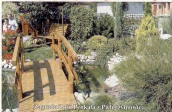
Zagroda Zofii Penkala z Pielgrzymowic.