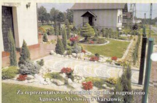
Za reprezentatywny charakter ogródka nagrodzono Agnieszkę Mysliwicę z Warszowic.