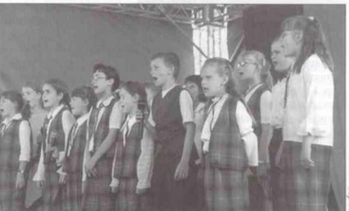
Zespół wokalny przygotował piosenkę o szkole.

poddaszu, remont sali gimnastycznej oraz wymianę dachu. Rozbudowano zaplecze sanitarne sali gimnastycznej, hol wejściowy z szatnią, kotłownię, jadalnię, sklepik, a także pokój zainteresowań, pokój nauczycielski, salę komputerową i bibliotekę. W dużej i przestronnej szkole znalazło się miejsce nie tylko dla podstawówki, ale i przedszkola. Przeznaczono dla niego dwie sale zajęć w nowo wybudowanej części. Wokół szkoły uporządkowano obejście, pojawił się również