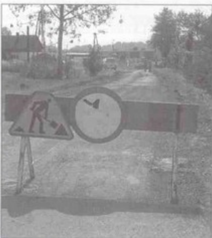
Droga do stacji benzynowej powinna być gotowa na początku października.

Jeżeli dopisze pogoda, to z początkiem października oddana zostanie droga dojazdowa do stacji benzynowej w Pawłowicach. Prace jeszcze trwają, ale ich zakończenie planowane jest na koniec września. Ulica będzie nieznacznie poszerzona, ale przede wszystkim pojawi się nowa nawierzchnia i nowa podbudowa. sb