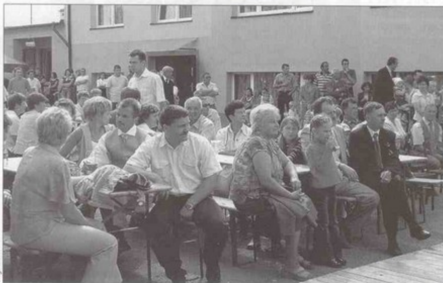
Na dożynki wybrało się wiele osób.

Żniwa się udały, więc i podziękowanie za plony, musiało być uroczyste. Przed liczną zgromadzoną publicznością wystąpił zespół Harmonia z Krzyżowic, dziecięcy ze-