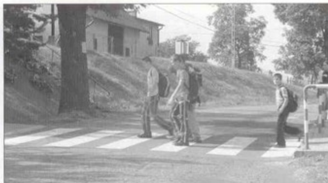
Bialo-czerwone przejścia widać z daleka. Dzieci mogą bezpiecznie przechodzić przez ulicę.

waż się do tego nie spieszył, ze względu na bezpieczeństwo dzieci inwestycję wykonał Urząd Gminy Pawłowice. Powiat zobowiązał się jedynie do wymiany oznakowania pionowego. sb