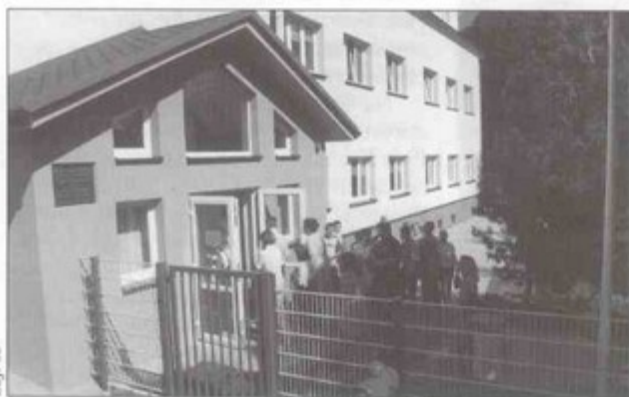
Po uroczystości zwiadano szkołę.