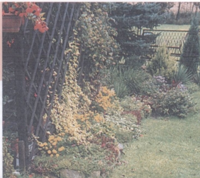
Golasowice zagroda państwa Plinta