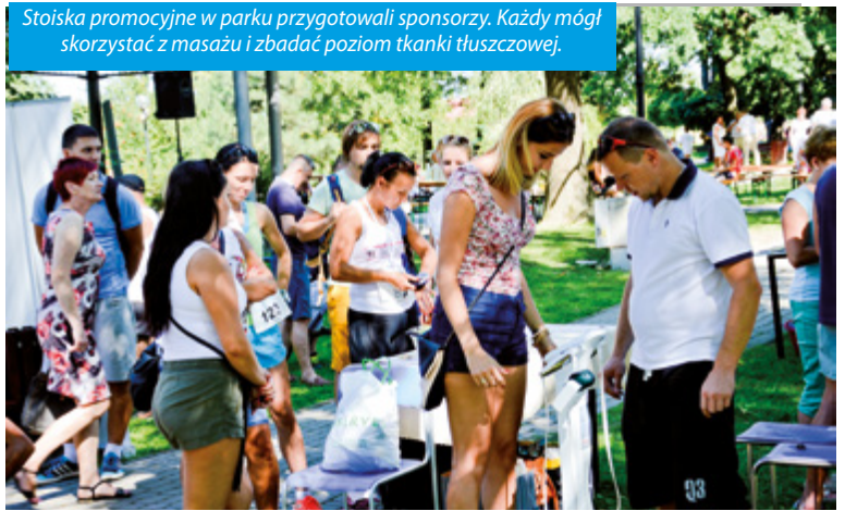
Stoiska promocyjne w parku przygotowali sponsorzy. Każdy mógł skorzystać z masażu i zbadać poziom tkanki tłuszczowej.

iców. Druga edycja Biegu Pawłowickiego przeszła do historii.