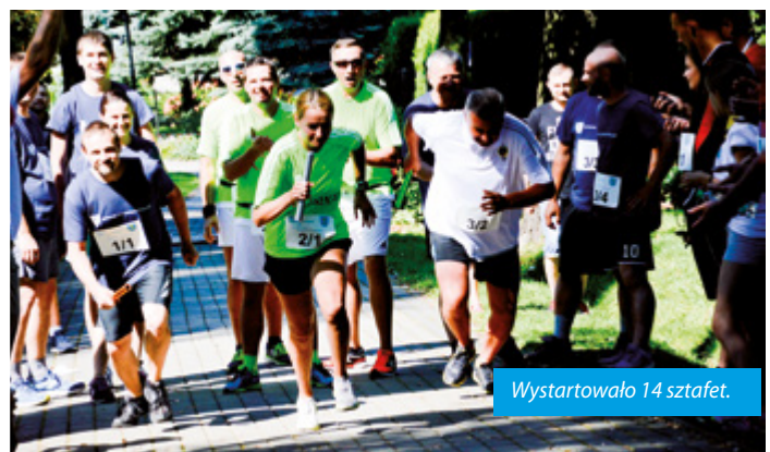
Wystartowało 14 sztafet.