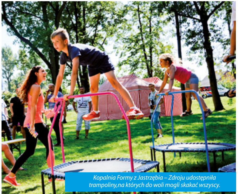
Kopalnia Formy z Jastrzębia – Zdroju udostępniła trampoliny, na których do woli mogli skakać wszyscy.