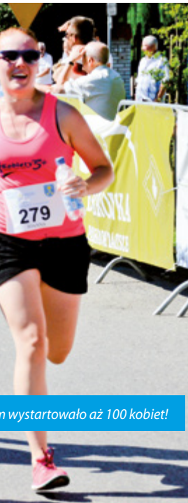
n wystartowało aż 100 kobiet!