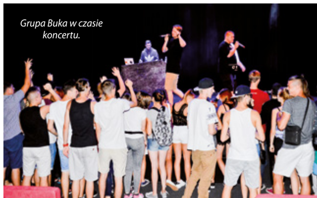
Grupa Buka w czasie koncertu.