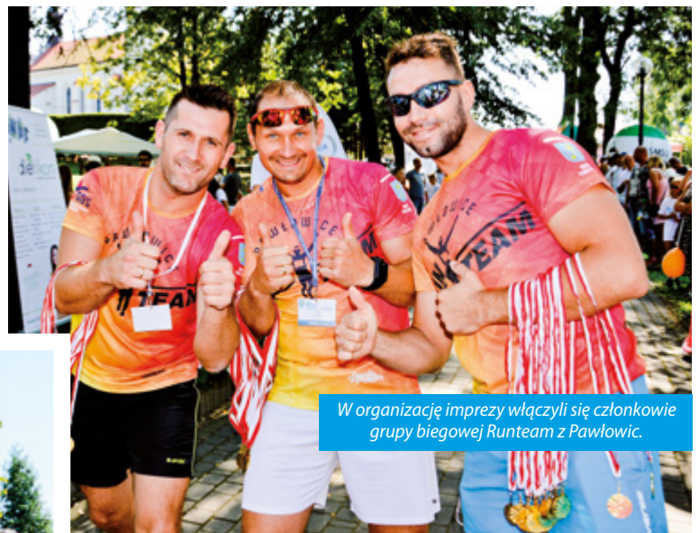
W organizację imprezy włączyli się członkowie grupy biegowej Runteam z Pawłowic.