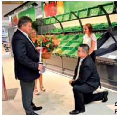
Uroczysty moment przyjęcia właścicieli sklepu do Grupy Muszkietierów.

Sklep jest czynny od godziny 9.00 do 21.00. bs