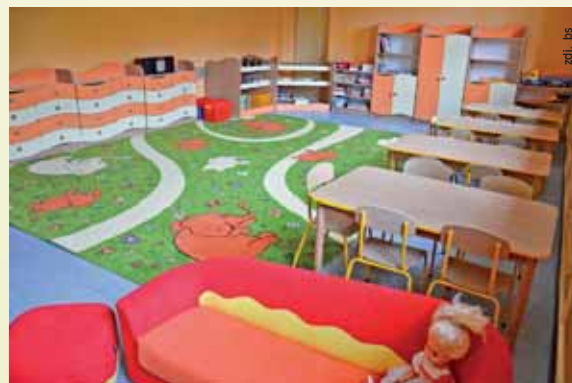
W szkole w Warszawicach powstala sala dla oddzialu przedszkolnego.

Od 1 września Przedszkole w Modrzewiuwim Ogrodzie weszlo w sklad Zespolu Szkolno – Przedszkolnego Nr 2 w Pawłowicach, ktorego dyrektorem jest Zofia Musiał. bs