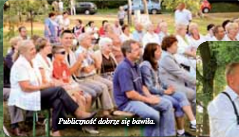
Publiczność dobrze się bawiła.