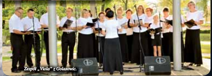
Zespół „Viola” z Golasowic.