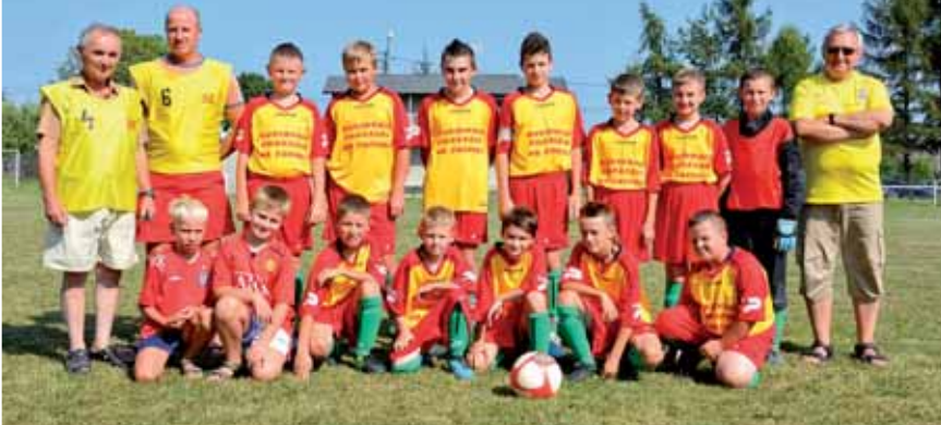
17 sierpnia nastąpił wielki dzień dla klubu z Golasowic. Reaktywowany został MKS „Promyk” Golasowice.