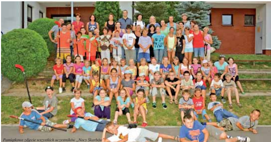
Pamiątkowe zdjęcie wszystkich uczestników „Nocy Skarbów”.