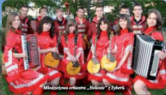
Młodzieżowa orkiestra „Heliosis” z Syberii.

Nie co dzień można posłuchać muzyki w wydaniu wykonawców z tak odległego miejsca jak Krasnojarsk. Podczas niedzielnego koncertu w pawłowickim parku wystąpiła Młodzieżowa Orkiestra Rosyjskich Instrumentów Ludowych Słoneczne Marzenia „Heliosis”, która przybyła do naszej gminy aż z Syberii.