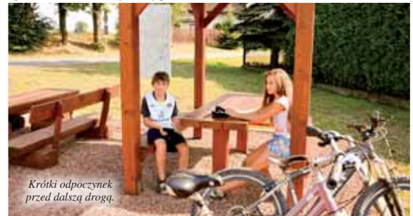
Krótki odpoczynek przed dalszą drogą.