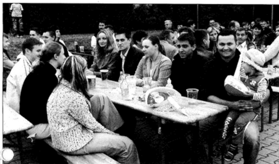
Na zabawę przyszło wielu mieszkańców sołectwa.