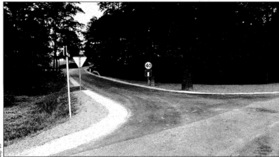
Widok na nową drogę od strony ulicy Wiejskiej.

Droga została poszerzona do 5 metrów. Prace wykonała firma Bud-Rol. bs