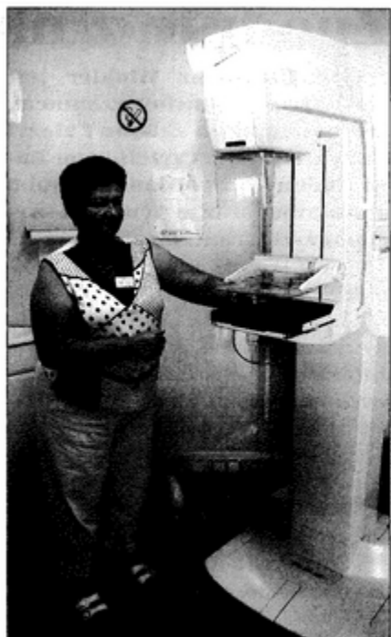
Mammografia to badanie piersi promieniami rentgena.

- W czasie stu badań wykrywamy średnio pięć drobnych niezłośliwych guzków. Więcej przypadków nowotworów jest w małych miejscowościach, gdzie świadomość kobiet jest też mniejsza. W mojej karierze, spotkałam się z pięcioma przypadkami złośliwego raka piersi. W większości rak był już mocno zaawansowany. Tu w Pawłowicach na szczęście nie było takiej sytuacji. Zaobserwowałam jedynie kilka