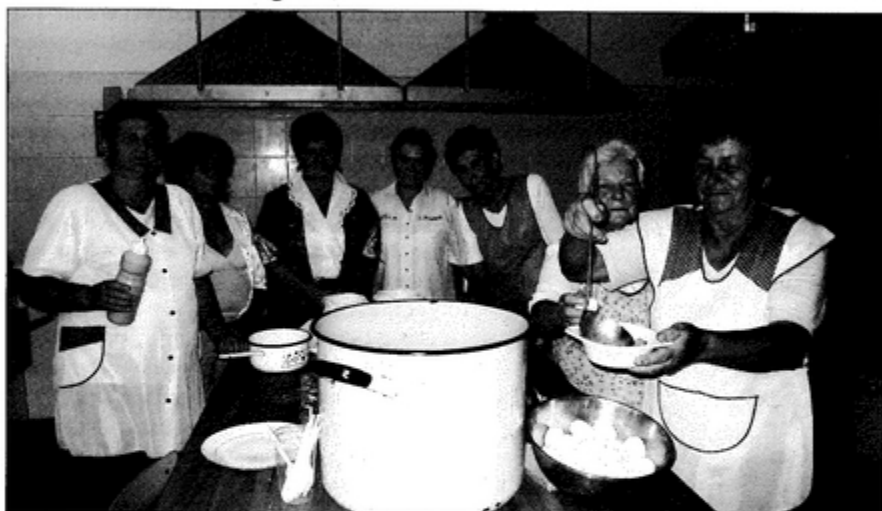
Panie z Koła Gospodyń Wiejskich przy dużym garnku z pysznym żurkiem.

Festyn dożynkowy odbył się w minioną niedzielę, 24 sierpnia na placu przy Domu Ludowym. Impreza rozpoczęła się o godz. 16.00 występem kabaretu Trio Piotra Szefera. W programie tegorocznego Święta Plonów znalazła się także loteria fantowa. Wygotowano ponad 100 losów, a wszystkie zostały sprzedane w ekspresowym tempie. – Można było wylosować urządzenie do