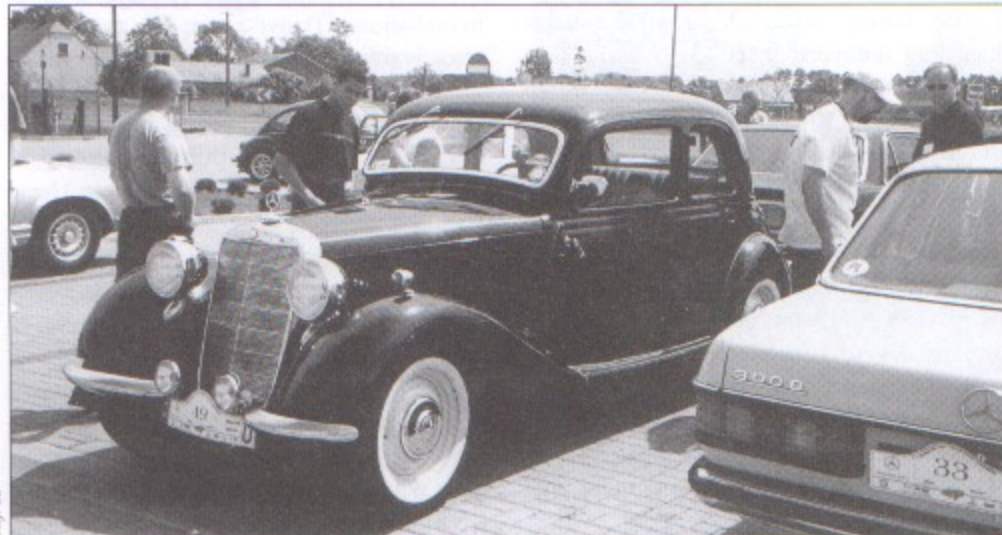
Ta piękna czarna limuzyna zdobyła 10 miejsce na 1200 załóg z całego świata.