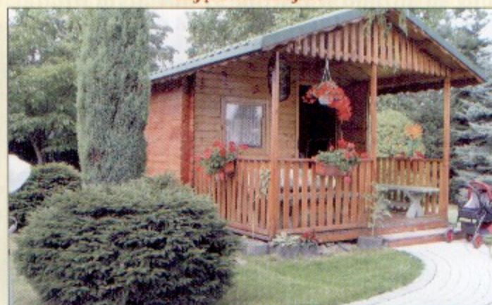
Drewniana altanka w ogródku Michaliny Świąder z Warszowic.