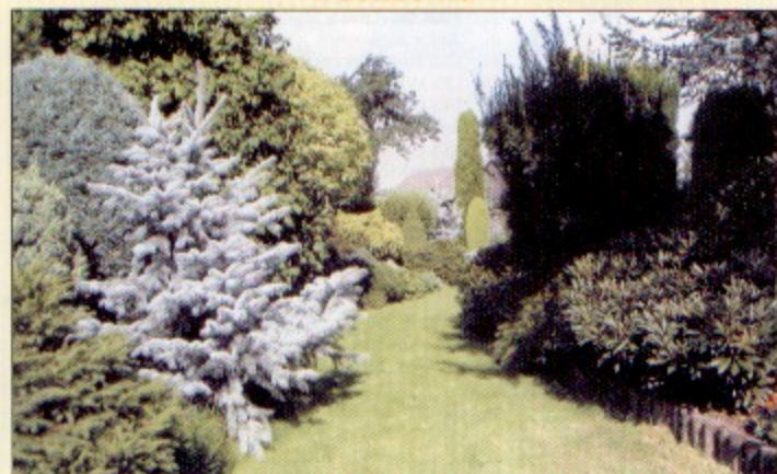
Ciekawe kompozycje krzewów u Hildegardy Grygierek z Pniówka.