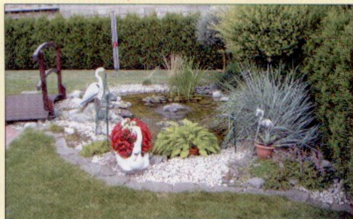
Malownicze oczko wodne w ogródku Małgorzaty Dudy z Golasowic.