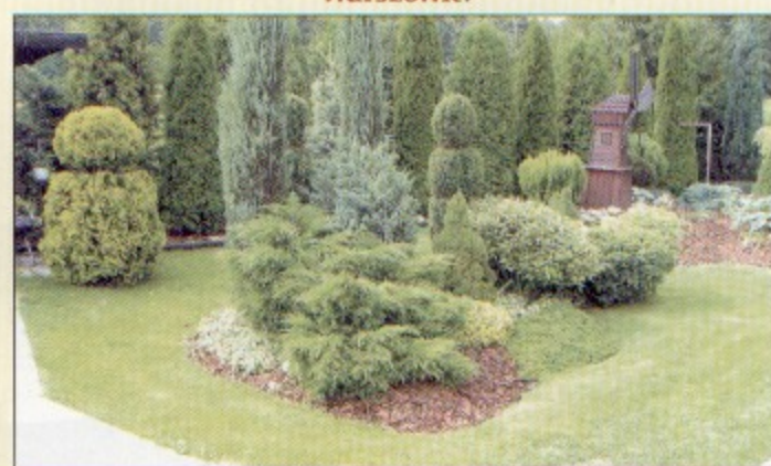
Kompozycje w ogródku Barbary Waclawik z Pielgrzymowic.