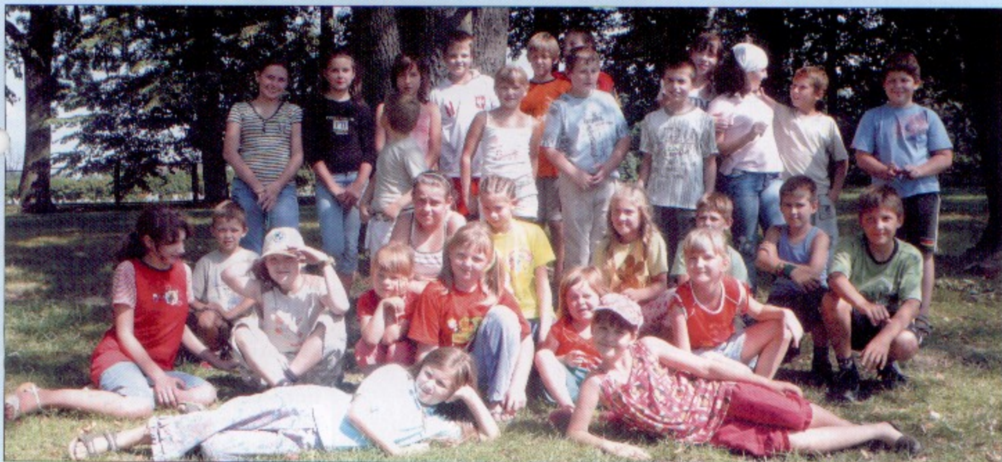
Pamiątkowe zdjęcie uczestników drugiego turnusu półkolonii.

120 racuchów oraz 150 klusek na parze czekało na uczestników półkolonii organizowanych przez parafię św. Jana Chrzciciela w Pawłowicach. W programie wakacyjnego odpoczynku były zajęcia teatralne, plastyczne, a na koniec spanie w salkach parafialnych na probostwie.