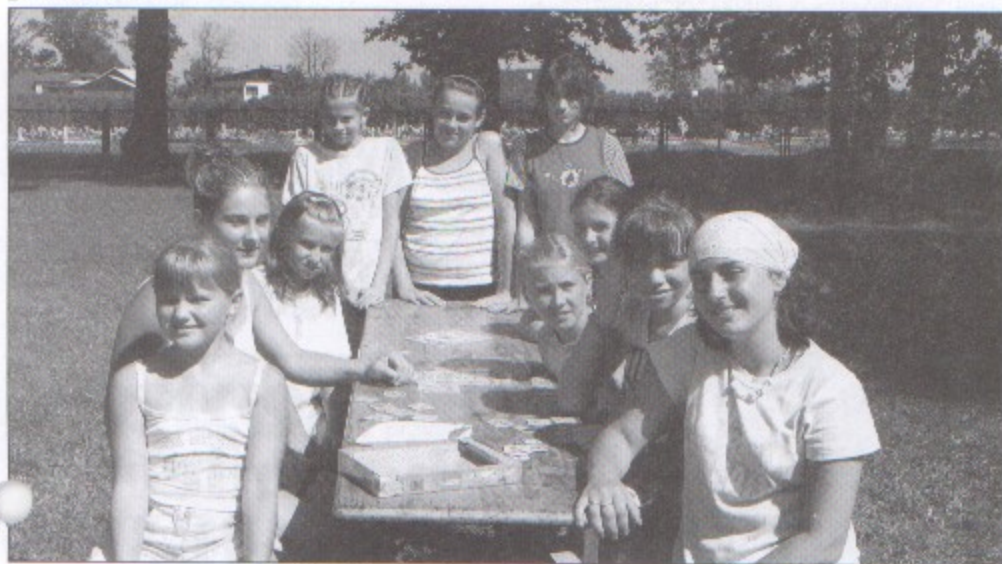
Półkoloniści w czasie wspólnej zabawy w ogrodzie.

120 racuchów oraz 150 klusek na parze czekało na uczestników półkolonii organizowanych przez parafię św. Jana Chrzciciela w Pawłowicach. W programie wakacyjnego odpoczynku były zajęcia teatralne, plastyczne, a na koniec spanie w salkach parafialnych na probostwie.