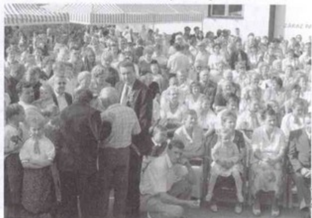
Uroczystość zgromadziła wielu mieszkańców Krzyżowic i okolicznych miejscowości.

Tradycją Święta Plonów są także smakowitości wiejskich gospodyń. Pyszny kolacz (60 blach), chleb ze smalcem i grochówka (800 porcji) nigdy nie smakują lepiej niż w czasie Gminnych Dożynek. bs