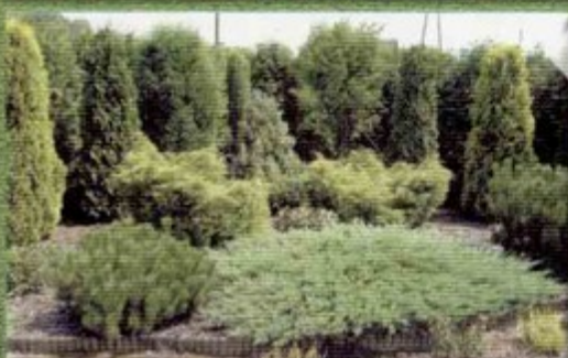
Staranne zagospodarowanie dużej przestrzeni ogródka Beaty Balas z Pielgrzymowic.