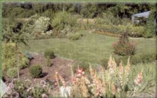
Różnorodność gatunkowa roślin w ogródku Lucji Groborz z Warszowic.