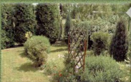
Krystynę i Jerzego Chmielów nagrodzono za czystość i porządek w całej zagrodzie.