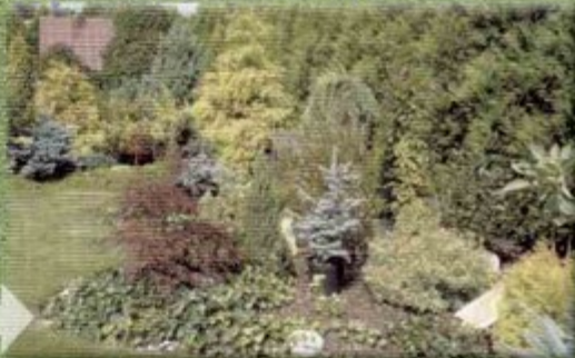
Najbardziej estetyczne kompozycje roślinne w ogródku Urszuli i Urbana Skorupów z Pawłowic.