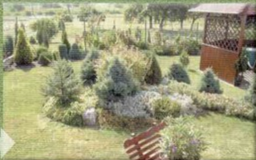
Pomysłowy ogródek Krzysztofa Pietrzyka z Pniówka.