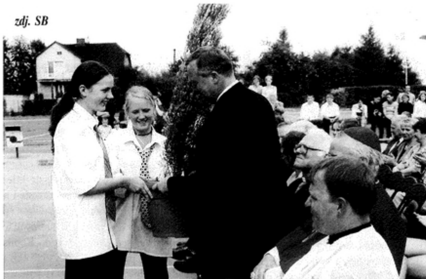
W dowód wdzięczności pomysłodawcom i wykonawcom inwestycji wręczono pamiątkowe rośliny. Obdarowani przekazali je na upiększenie terenu wyremontowanej szkoły.