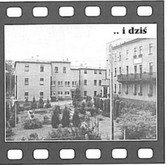
.. i dziś