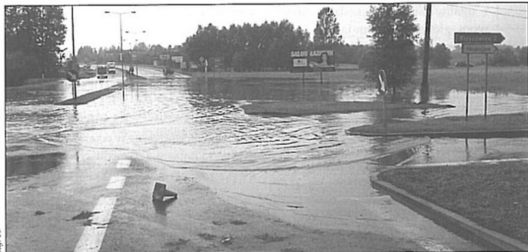
Skrzyżowanie DW 933 z ulicą Orlą w Pniówku było nieprzejezdne przez kilka godzin.

kretnych działań, sytuacja będzie się tam powtarzać przy każdym większym deszczu. Od czasu powodzi, która nawiedziła naszą gminę w maju i czerwcu, KWK „Pniówek” nie zrobiła nic, aby problem rozwiązać. Konieczne jest zapowiadane od kilku lat rozpoczęcie prac w celu zapewnienia grawitacyjnego spływu Pawłówek. bs