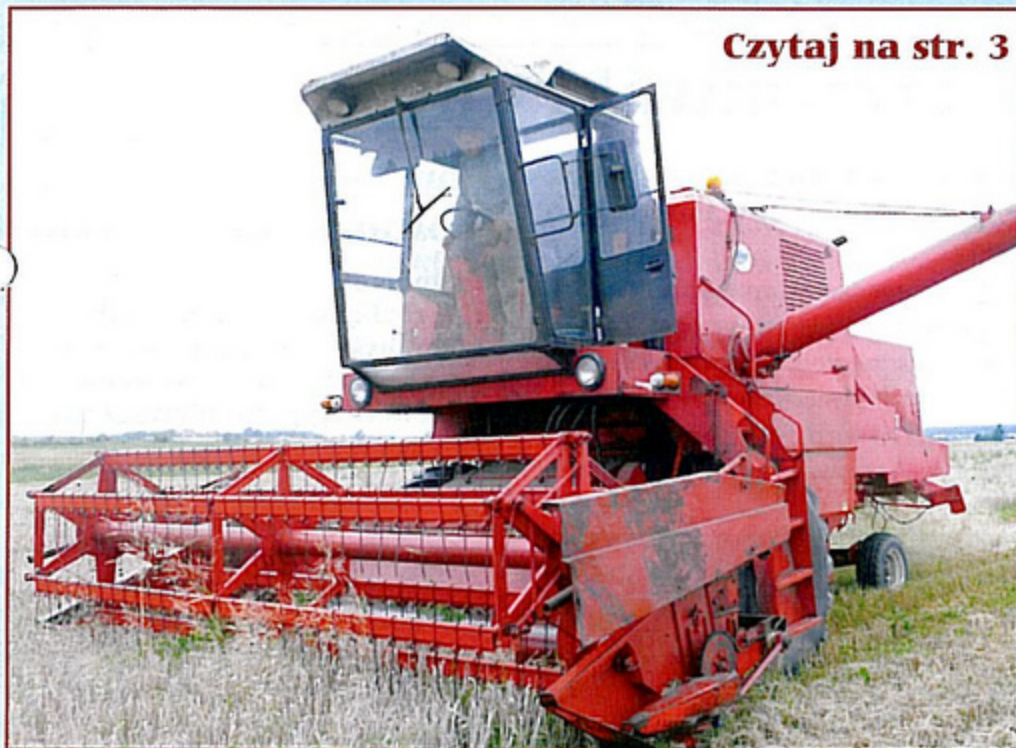
Alfred Hejnal z Krzyżowic z niepokojem obserwuje tegoroczne zbiory.