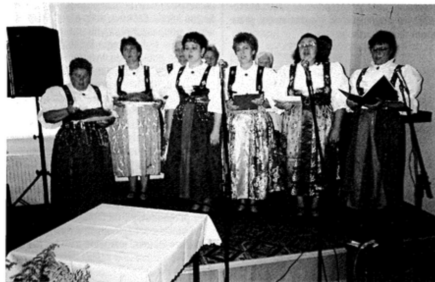
Jarząbkowianki jak zawsze... barwnie i wesoło

Po południu około godziny 16.00 wystąpił popularny kabaret: "U bacy" a wieczorem zaczęła się trwająca do północy zabawa taneczna z zespołem muzycznym Orion.