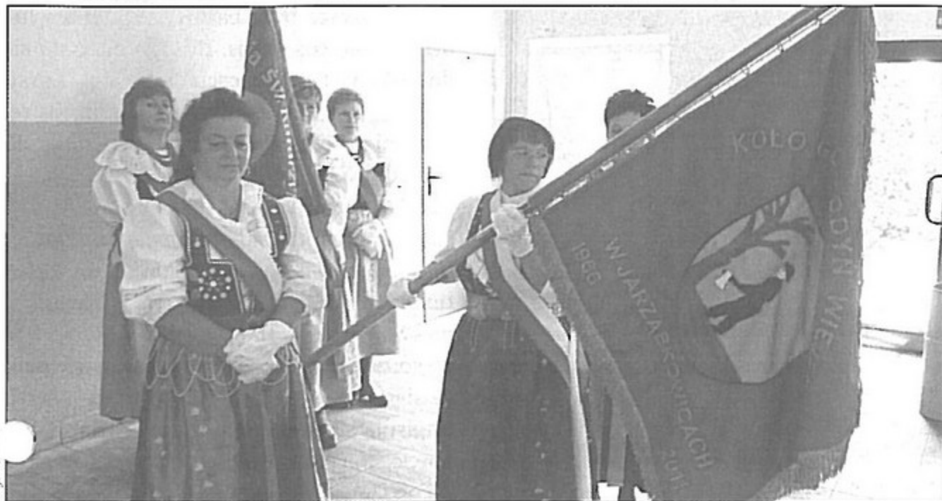
KGW w Jarząbkowicach ma już swój sztandar.