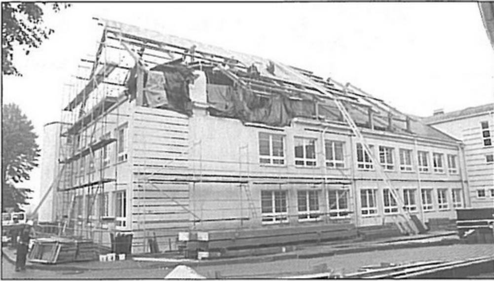
Trwa budowa auli przy Gimnazjum nr 1 w Pawłowicach.

Wymiana okien, drzwi, posadzek. Odmalowanie ścian, naprawa połamanych krzeseł. Kiedy uczniowie odpoczywają na wakacjach, ekipy remontowe odświeżają szkoły przed kolejnym wrześniem.