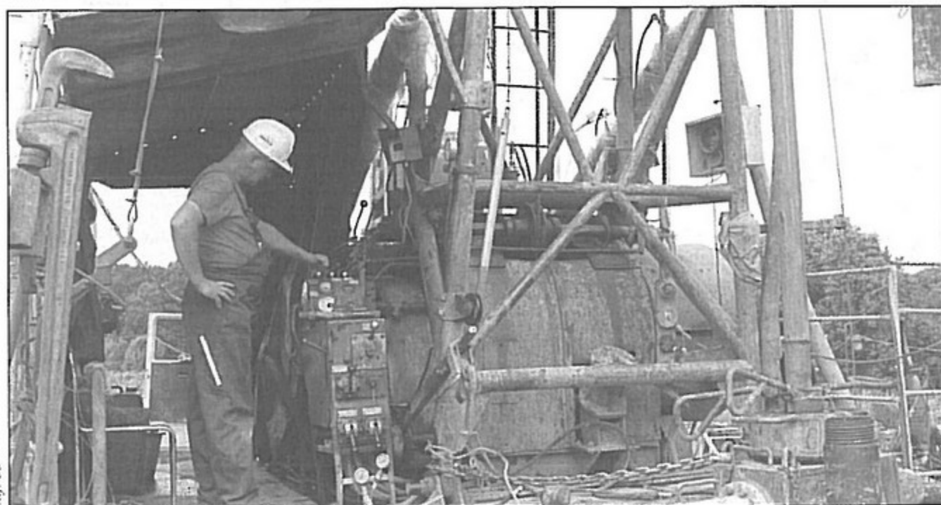
Robotnicy dotarli już do głębokości 1200 metrów.

Jastrzębska Spółka Węglowa od końca maja draży w Golasowicach otwór badawczy o głębokości 1375 metrów. Dzięki temu geolodzy będą mogli zbadać próbki węgla i skał.