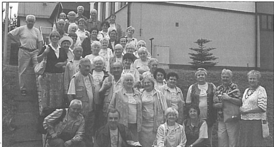
Uczestnicy wycieczki do Pawłowic.

Goście nie przyjechali do Pawłowic z pustymi rękoma. Przywieźli broszury z IV Złotu Pokoleń Harcerskich w Ostrowach-Górnicych oraz przekazali na rzecz powodziarzy z Krzyżowic pieniądze zebrane w czasie zlotu. bs