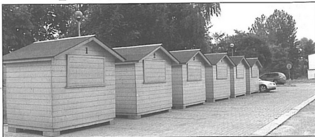
Na razie nie ma chętnych do sprzedawania na nowym placu targowym.

Pomysł wybudowania targowiska narodził się po tym, jak właściciele sklepów przy ul. Górniczej złożyli petycję do wójta gminy o uporządkowanie handlu obwoźnego, który od kilku lat rozwija się obok Tesco. Jak czytamy w piśmie: „My, właściciele sklepów przy ul. Górniczej wyrażamy swoje NIE przeciwko handlowi ulicznemu, który rozkwita obok nas. Tworzy to niezdrową konkurencję dla nas placących dzierżawę, czynsze, podatki, bieżące rachunki za wodę, prąd, gaz, wywóz śmieci”.