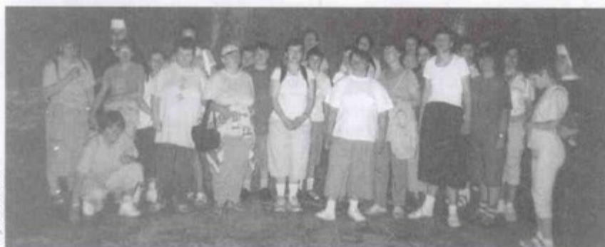
Uczestniczki wycieczki w kopalni soli w Wieliczce.

Wzorem lat poprzednich, Ośrodek Pomocy Społecznej w Pawłowicach zorganizował wycieczkę z okazji „Dnia Dziecka” dla podopiecznych Domu Pomocy Społecznej w Pielgrzymowicach.