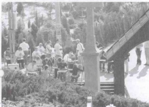
Kościół w Pielgrzymowicach jest wdzięcznym obiektem dla artystów.

Urząd Gminy w Pawłowicach wraz ze Stowarzyszeniem Kulturalno - Społeczny Karola Miarki w Pielgrzymowicach w dniach od 27 sierpnia do 3 września będzie realizował projekt pod nazwą „Artystyczna tęcza – kultura buduje obywatelską Europę”. W spotkaniu wezmą udział 10-osobowe reprezentacje miast partnerskich Pawłowic: z Verquin (Francja), Teplicki nad Vahom (Słowacja) oraz Perkupy (Węgry). Miejscem projektu będą Pielgrzymowice.