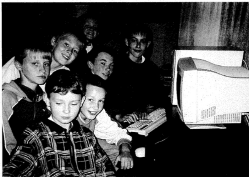
W świetlicy przy komputerze...

Czy warto posłać dziecko na zajęcia dodatkowe