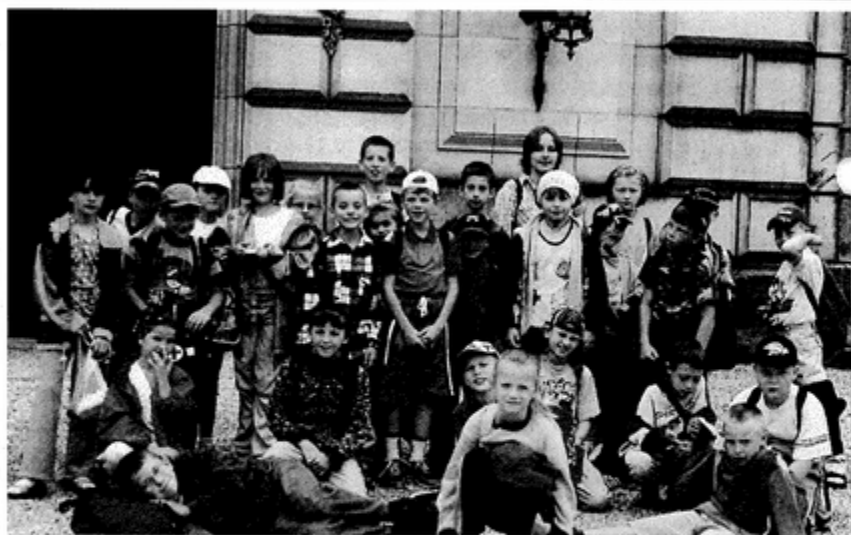
Każda wycieczka była nielada atrakcją

Półkolonie odwiedził przedstawiciel Kuratorium z Bielska-Białej, a także pani redaktor z Dziennika Zachodniego, która napisała o półkoloniach.