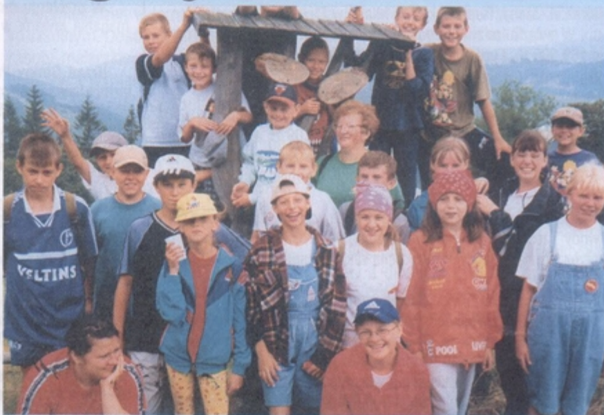
Uśmiechnięte miny najlepiej świadczą o atmosferze na półkoloniach

Tak, tak lato powoli dobiega końca a wakacje są już tylko wspomnieniem. Dla wielu młodych mieszkańców naszej gminy - bardzo miłym wspomnieniem. Szczególne powody do zadowolenia mieli uczestnicy półkolonii dla których przygotowano liczne atrakcje. Pisaliśmy o nich na bieżąco, dziś nadszedł czas podsumowań.