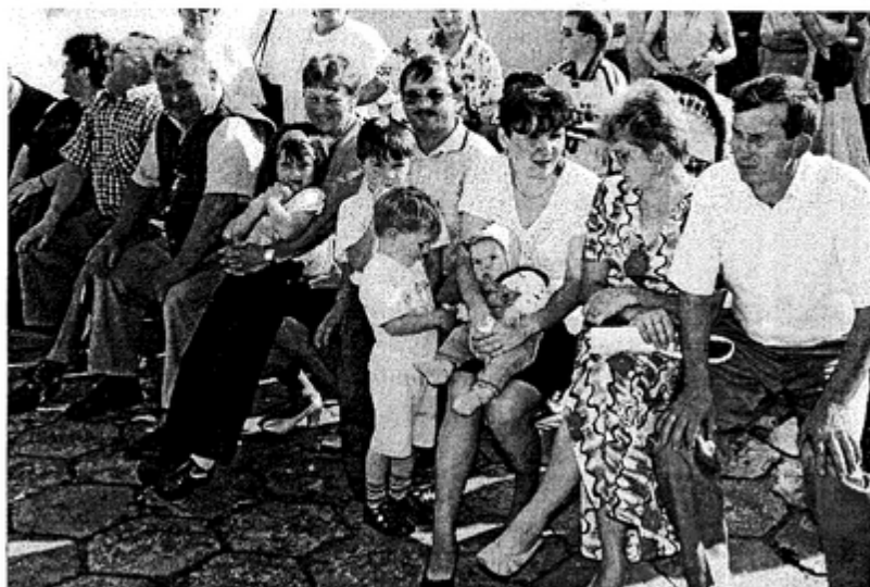
Bawiły się całe rodziny

nika były jakieś problemy z nagłośnieniem i nie zawsze w każdym miejscu było dobrze słycać. Artyści potrafili jednak dać dobry koncert niezależnie od kłopotów technicznych a publiczność reagowała niezwykle żywiołowo okłaskując swych ulubieńców. Każdy mógł spróbować szczęścia w loterii fantowej lub stracić trochę grosza w obficie zaopatrzonych bufetach. Orkiestra z Pniówka koncertowała a w przerwach odbywały się konkursy dla najmłodszych. Uroczystość zakończyła zabawa taneczna i występ zespołu "Walyncioki."