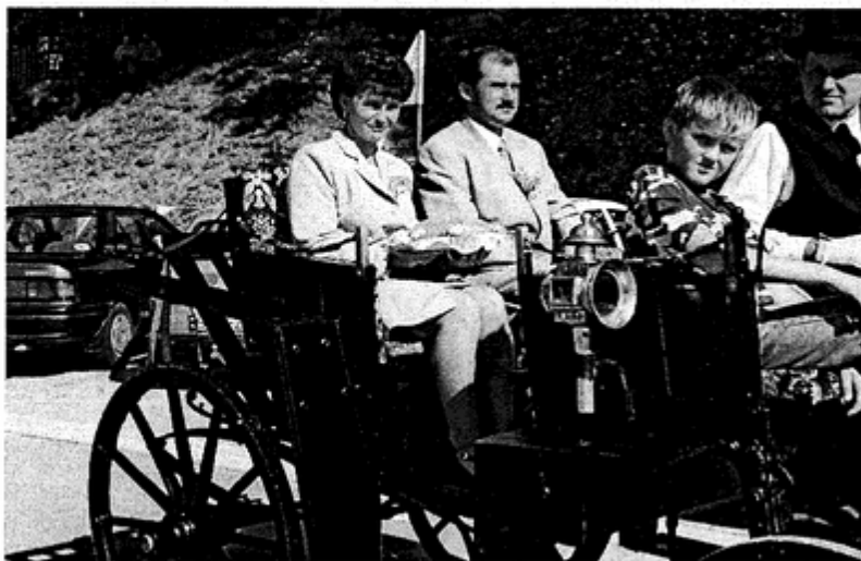
Starostowie prezentowali się godnie

prośbami. Słowa szczególnie wzruszające, przemawiające do serc i umysłów wiernych - padły podczas kazania: o wartości ludzkiej pracy, godności człowieka o Bogu który jest Ojcem, Stwórcą, Panem.