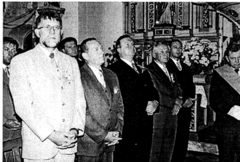
W modlitewnym skupieniu

Starostowie nie zostali wybrani przypadkowo. Jak za-