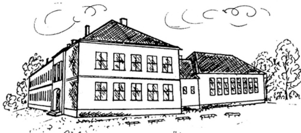
Szkola przed remontem...

Był czas na zwiedzanie szkoły, wspomnienia i pogaduchy w gronie dawnych kolegów ze szkolnej ławy. Wiele nobliwych dziś pań i