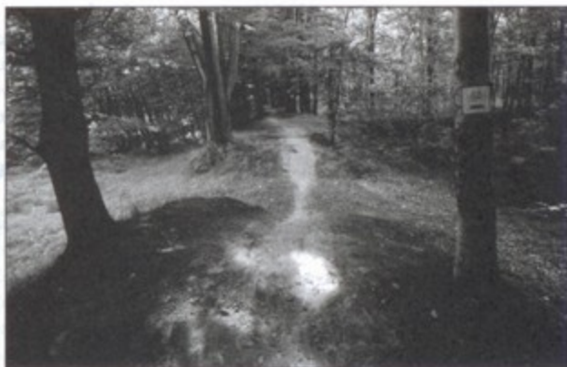
Trakt Cesarsko-Pruski to jedna z najciekawszych tras rowerowych w naszym regionie.

Bąków, ul. Łączna 4, tel. 033/857 11 30 0509 227 780 Zapraszamy!