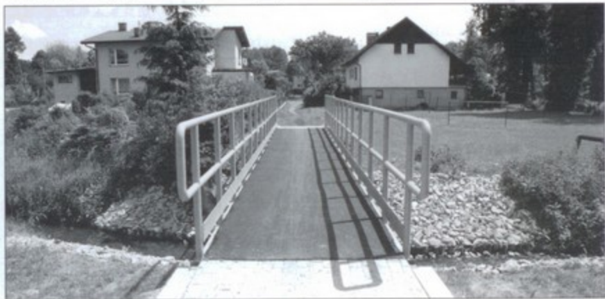
Kładka dla pieszych przy ulicy K. Miarki.

Zgodnie z umową między gminą Pawłowice a inwestorem zadania, którym jest Śląski Zarząd Melioracji i Urządzeń Wodnych w Katowicach, koszt remontu obiektów dzielony jest na pół. Zarząd zapłaci za remont mostu przy ul. Słonecznej oraz kładki dla pieszych, a gmina sfinansuje koszt remontu mostu przy ul. Karola Miarki. bs