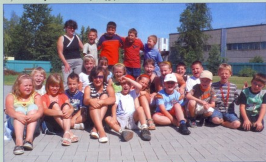
Uczestnicy pierwszego turnusu półkolonii.

Pawłowice to jedna z niewielu miejscowości w naszym regionie, gdzie dla dzieci pozostających w domach zorganizowano wakacje w miejscu zamieszkania. Piękna, słoneczna pogoda sprawiła, że pierwszy turnus półkolonii był wyjątkowo udany.