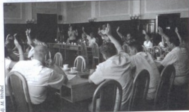
Głosowanie nad wyborem władz stowarzyszenia.