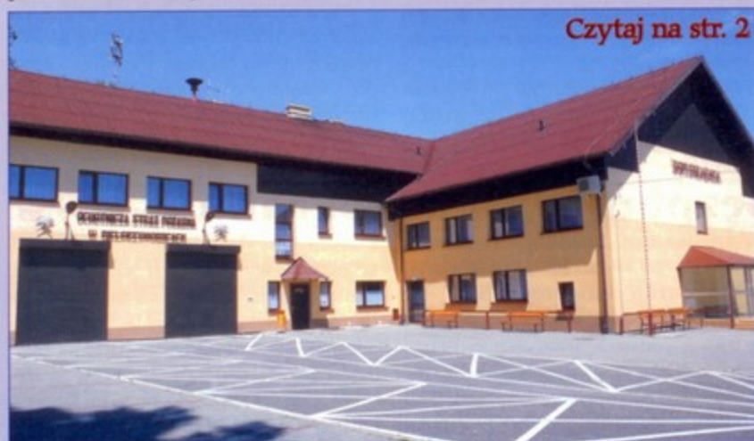
Tak po remoncie prezentuje się strażnica.