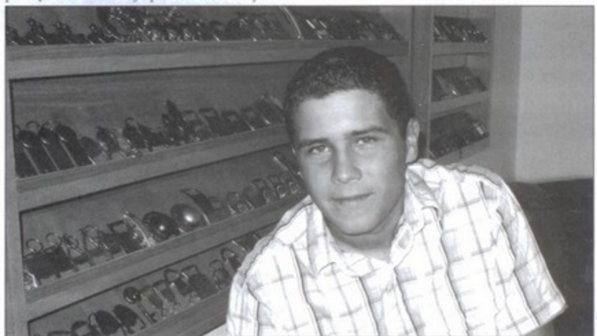
Mieszkaniec Warszowic ma w swojej kolekcji prawie 300 metalowych otwieraczy do piwa.