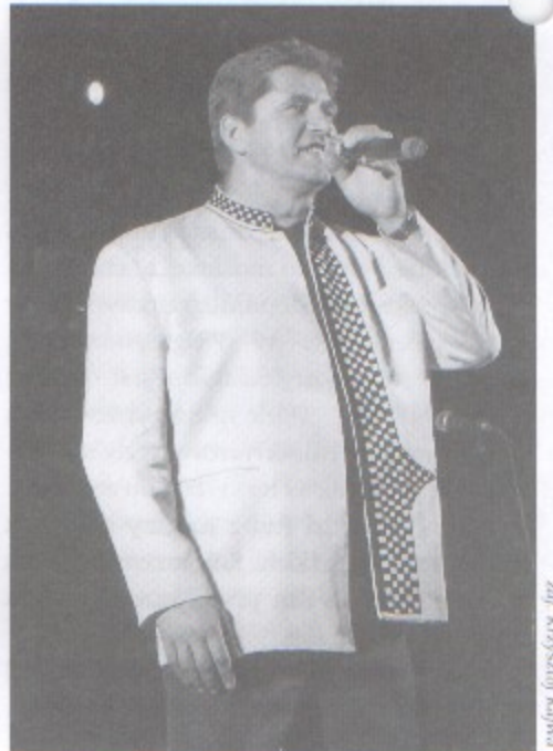
Śławomir Świerzyński, lider i wokalista zespołu Bayer Full.