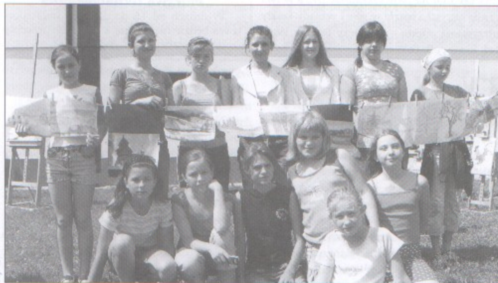
Uczestniczki pleneru pokazują wykonane przez siebie prace.