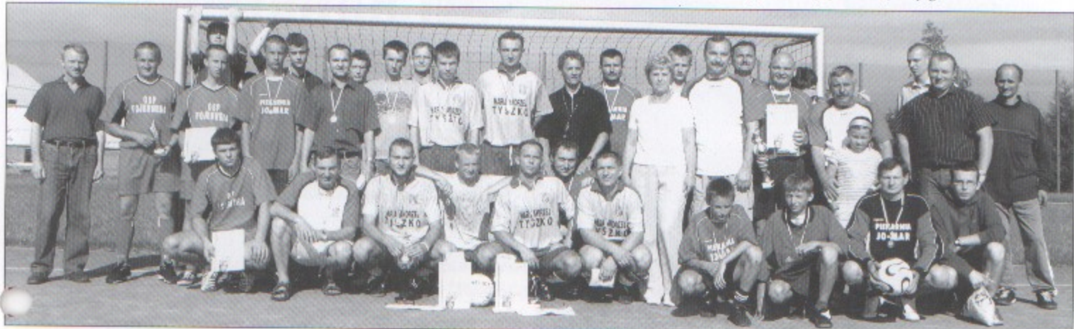
Trzy najlepsze drużyny piłkarskich rozgrywek.