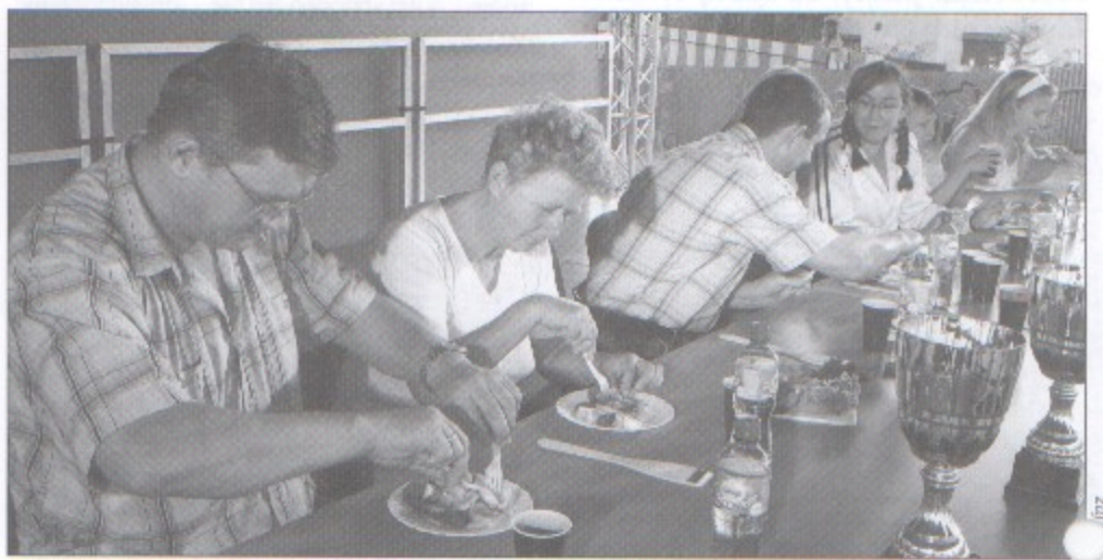
Przygotowane potrawy oceniała komisja złożona z mieszkańców naszej gminy.

Tym razem sprawdził się on w roli prowadzącego konkurs kulinarny. Wielkie gotowanie rozpoczęło się po południu na scenie za Domem Kultury. Przy garnkach i patelniach stanęły dwuosobowe ekipy - restauracji przy stacji paliw „Uniwar”