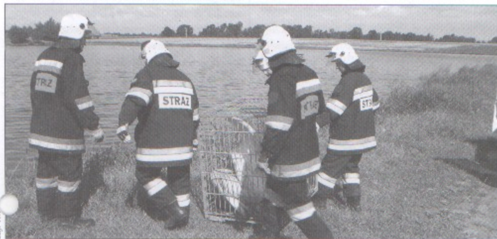
W przeprowadzce łabędzi pomagali strażacy z Pawłowic.

Jak powiedzieli nam strażacy, starają się nimi opiekować i przynoszą im chleb. Pisklęta mają się dobrze i już podrosły. Jednak zdolność lotu osiągną dopiero pod koniec sierpnia lub we wrześniu. Młode łabędzie są z reguły szarobrązowe i dopiero w wieku trzech lat stają się zupełnie białe. bs