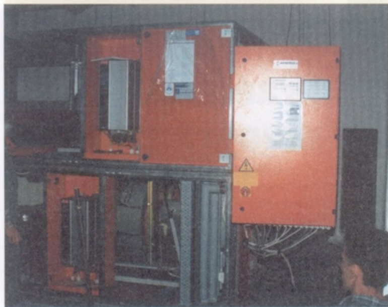
Ta niepozorna i nieciekawie wyglądająca na zdjęciu szafa, to jedno z najnowocześniejszych i najważniejszych urządzeń na basenie. Zwykły użytkownik jednak nigdy jej nie zobaczy, dlatego też macie Państwo unikalną okazję obejrzenia tego, co prawie pod dnem basenu.

Cóż, lato w pełni ale po sezonie chyba nie warto zbyt głęboko chować do szafy kostiumów kąpielowych. Wkrótce mogą się przydać na naszym basenie.