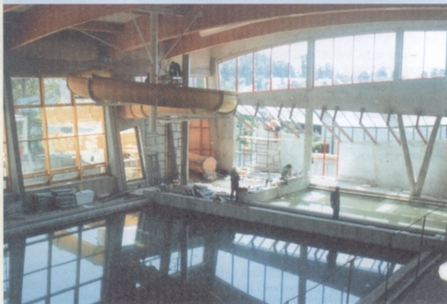
Woda w basenie - czyli szczelne dno to ogromny sukces budowlanych.

Słyszałem, że pod basenem schowano mercedesa. Wiadomość ta, wydała mi się nieprawdopodobna ale czego się nie robi dla czytelników: poszedłem i sprawdziłem. Pra-