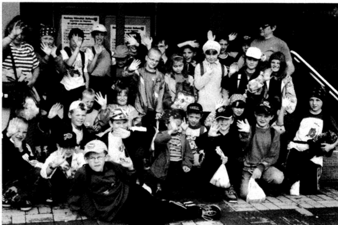
Uśmiechnięte buzie kolonistów najlepiej oddają atmosferę wspólnego wypoczynku.

W czasie trwania turnusu dzieci zdobywały pieszo szczyty np.