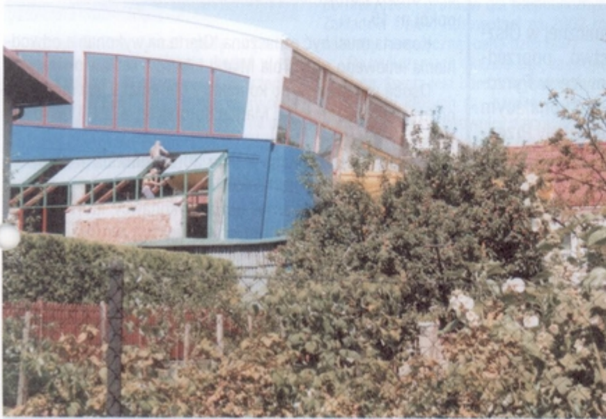
Nowoczesna bryła basenu wzbudza ogólne zainteresowanie