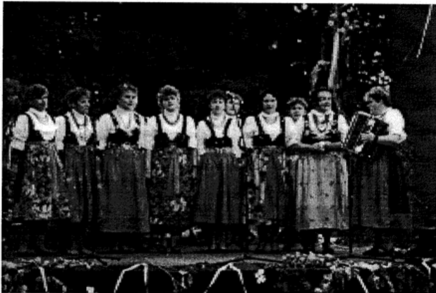
A to jedno z historycznych zdjęć „Jarząbkowianek” (podczas występów na Gminnych Dożynkach)

Perspektywę oraz nadzieję stwarza nam wielokodowa decyzja Rady Gminy i Zarządu Gminy o budowie Domu Ludowego wraz z remizą strażacką. Ta budowa już trwa i szybko postępuje. Doceniając wagę postanowienia władz gminy - pozwolił sobie powiedzieć, że przez lata wytrwałe na pracowaliśmy. Jako jarząbkowicka społeczność i jako działaczka. Pisząc o działaczach myślę w równym stopniu i tych "od kultury" jak też o tych "od gaszenia".