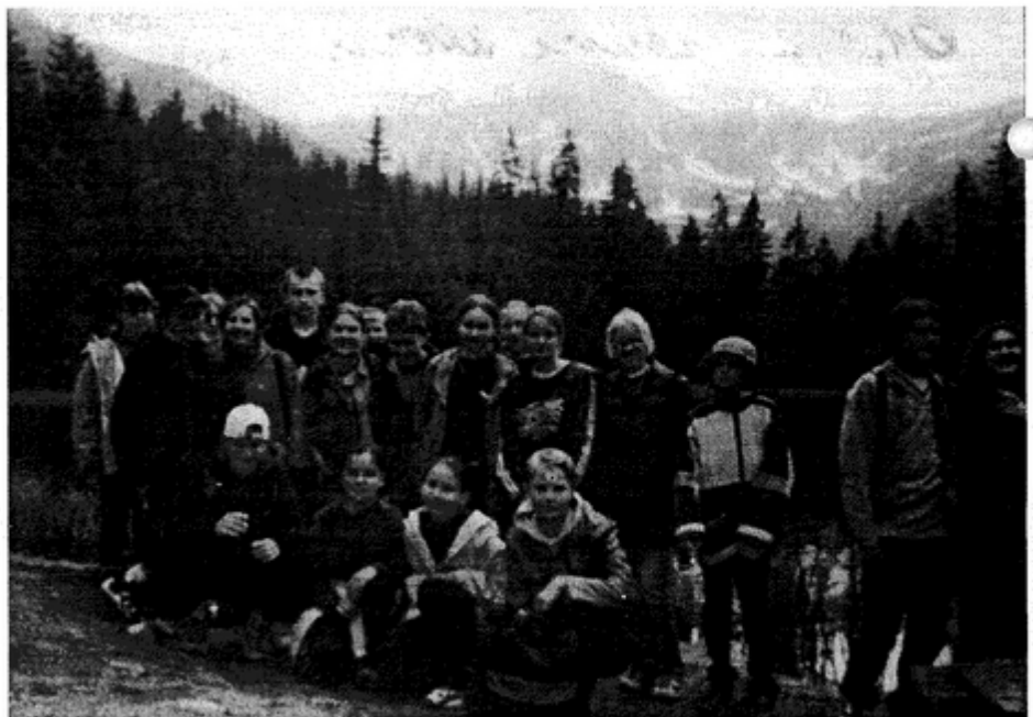
Nad stawem Smreczyńskim byliśmy przekonani, że to najbardziej urokliwy zakątek w Tatrach

Najlepsi uczniowie spędzili dwa pierwsze dni czerwca w Zakopanem i w Tatrach. Pogoda, humory i kondycja dopisały w stu procentach. Uczniowie zwiedzili Muzeum Tatrzańskie, podziwiali niepowtarzalną architekturę starych zakopiańskich willi, przemierzali gwarne i ludne Krupówki, odwiedzili stare i nowe kościoły. Długi spacer Doliną Kościeliską był wspaniałym przeżyciem i nikogo nie zmęczył. Szczególny zachwyt wzbudził Staw Smreczyński i widoczne z jego brzegu szczyty Tatr Zachodnich. Dziewczyny - zauróżnione krajobrazem i ciszą, za żadne skarby nie chciały tego miejsca opuszczać. Nie wiedziały, że jest w Tatrach jeszcze piękniejszy zakątek. To Morskie Oko, nad które dotarliśmy następnego dnia. Wspaniały widok potężnych ścian skalnych otaczających jezioro i odbijających się w jego tafli wynagrodził uczniom trudy dwugodzinnego marszu do Morskiego Oka, a jego wspomnienie ułatwiło pokonanie drogi powrotnej. Na pożegnanie z Tatrami uczestnicy wycieczki podziwiali pa-