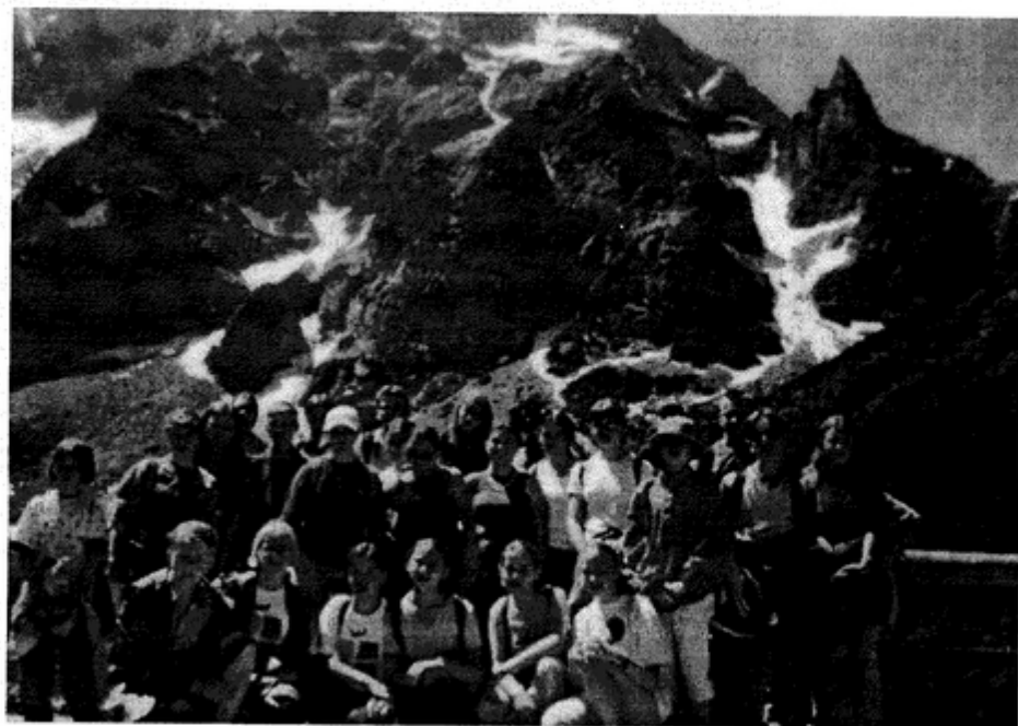
Uczestnicy wycieczki nad Morskim Okiem. Większość uznała, że jednak to jest najpiękniejsze miejsce w Tatrach