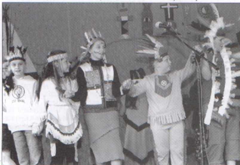
Uczniowie szkoły w czasie występu.

Festyn, który odbył się w Golasowicach, to znakomity dowód na to, że dzięki entuzjazmowi, ale przede wszystkim oryginalnemu pomysłowi, można zorganizować imprezę pod przysłowio-wą chmurką dla szerokiego grona zadowolonych odbiorców. Kolejny festyn znowu za rok! bs