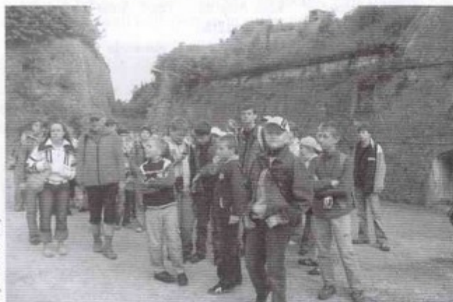
zof. areh. szkoly

29 maja z Pawłowic do Gór Stołowych wyruszył „wesoly autobus” pełen tzw. kujonów lub orłów. Najliczniejszą grupę stanowili w nim przedstawiciele Gimnazjum nr 1, a wśród uczniów podstawówek dominowali najlepsi z „Dwójki”.