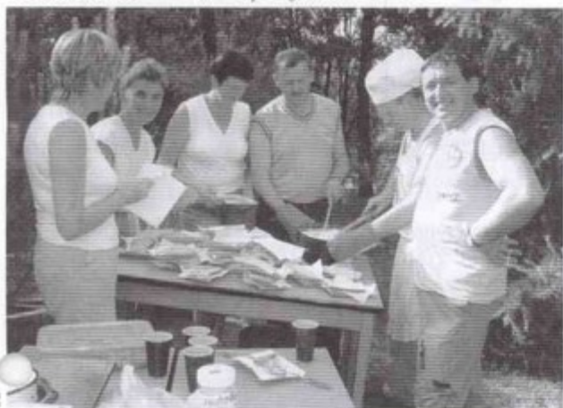
Organizatorem spotkania jest Rada Parafialna.