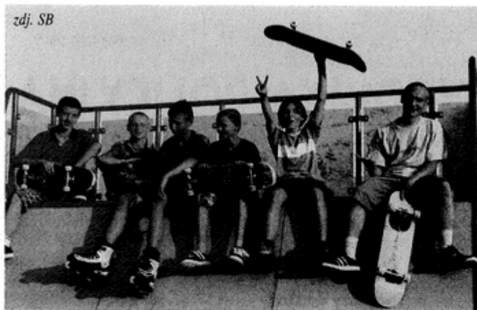
Chwila wypoczynku przed następnym zjazdem