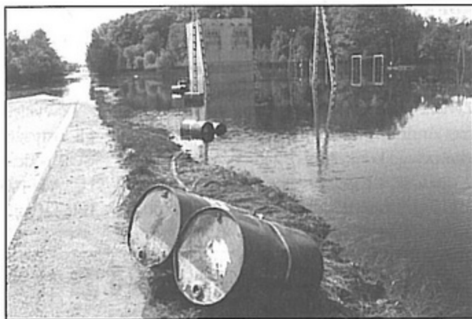
Tak wyglądało zalewisko przy DW 933 w dniu 8 czerwca. Kolejnego dnia na jezdni nie było już wody.

W celu wypompowania tak dużej ilości wody, w rejonie pompowni H-2 dodatkowo wykonano, poprowadzone z KWK Pniówek, prowi-