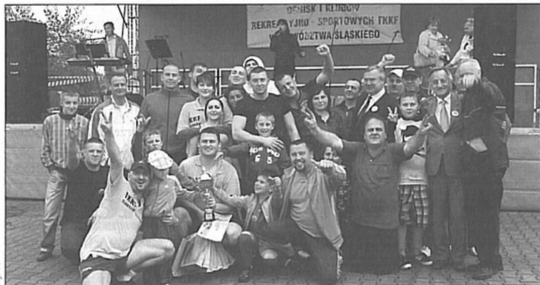
Nagrodzeni sportowcy tuż po ogłoszeniu wyników. Na zdjęciu są również organizatorzy Zlotu.

Zlot zakończył się wręczeniem pucharów i nagród zwycięzcom poszczególnych konkurencji. Zwyciężył klub z Jastrzębia, przed ekipą z Raciborza i Czeladzi. Nasi reprezentanci TKKF „Rozwój” Pawłowice uplasowali się na wysokim 9 miejscu, zdobywając III miejsce w siatkówce plażowej, piłce nożnej i koszykówce. To najlepszy wynik pawłowiczian w dotychczasowej historii startów w wojewódzkim zlocie. Wszyscy pełni wrażeń umawiali się na spotkanie za rok. bs