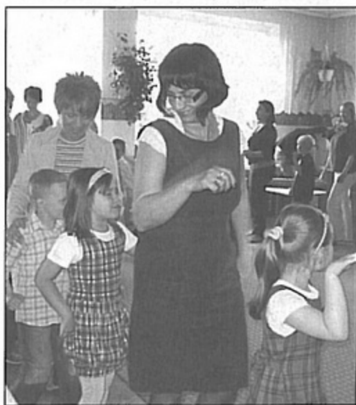
Mamy bawiły się wspólnie z dziećmi.

To była wyjątkowa uroczystość i wszystkie mamy opuściły przedszkole z uśmiechem na ustach. bs