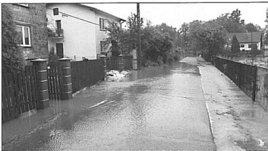
Przez ulicę Karola Miarki w Piętrzymowicach przelewała się woda.