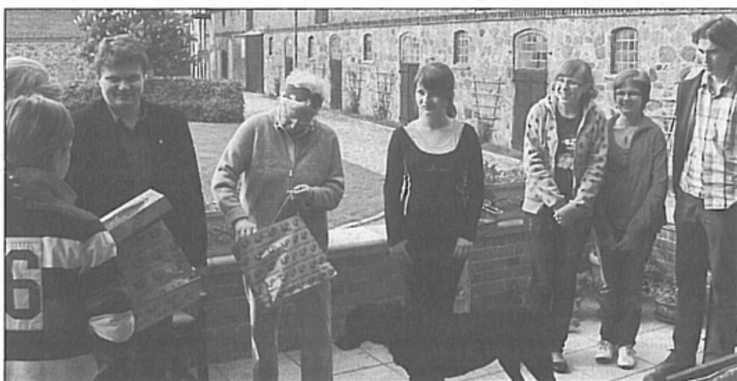
Grupa z Pawłowic przywiozła gospodarzom prezenty: m.in. swojską kielbasę, miód, chleb i kolocz.