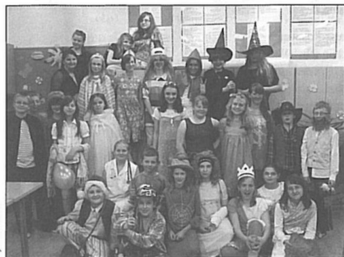
Uczestnicy wyjątkowej nocy spędzonej w bibliotece.

Młodzi czytelnicy przyszedli do biblioteki o godz. 17 w piątek (14 maja), a wyszli z niej o... ósmej rano w sobotę.