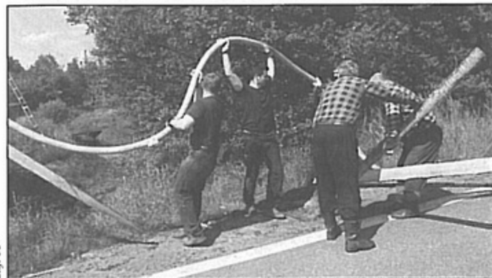
Z KWK "Pniówek" pociągnięto specjalny kabel do zasilania pompy.