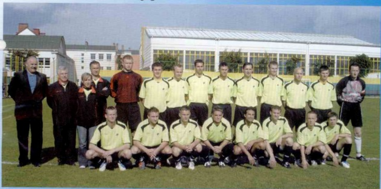
Zwycięska drużyna GKS Pniówek.