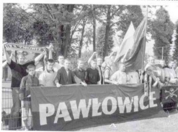
Klub kibica cieszy się z awansu.