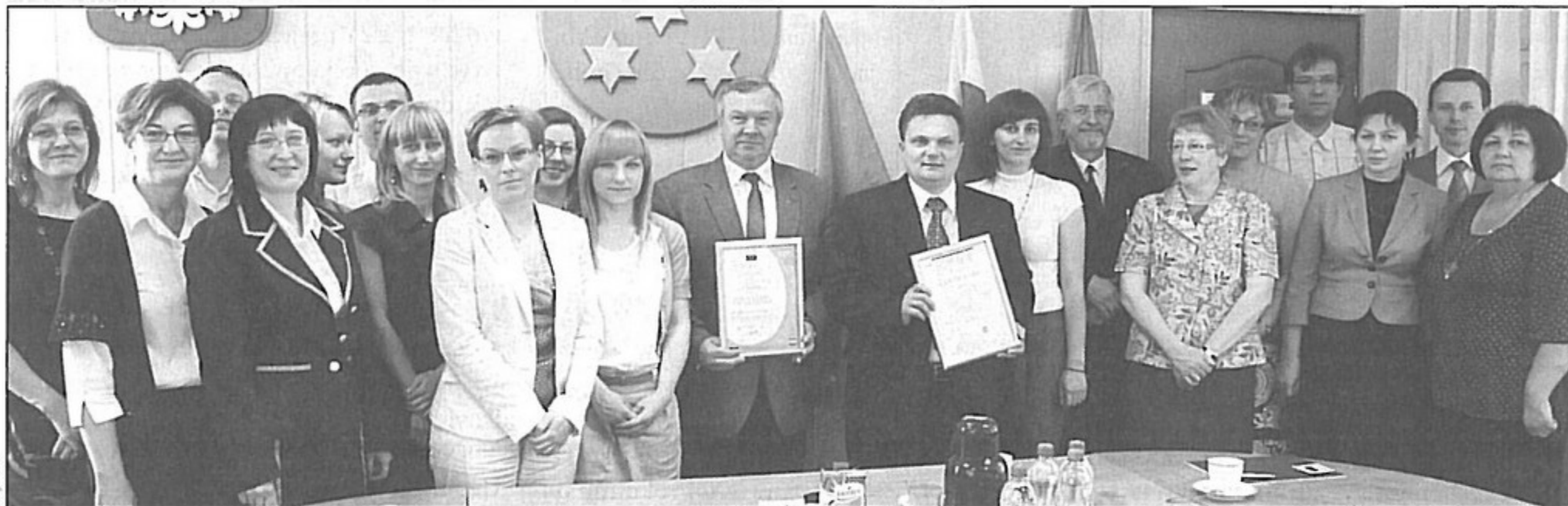
Przyznanie certyfikatu zgodności z normą PN-EN ISO 9001:2009 to sukces wszystkich pracowników Urzędu Gminy Pawłowice.

Pawłowicki urząd jako pierwszy w powiecie pszczyńskim urząd administracji samorządowej wdrożył certyfikowany system zarządzania jakością za pieniądze Unii Europejskiej. W kwietniu audyt kontrolny urzędu przeprowadził lider w branży certyfikacji wyrobów i usług - firma IMQ S.A. z Krakowa. Kontrola potwierdziła spełnianie przez urząd wymagań zawartych w normie PN-EN ISO 9001:2009.