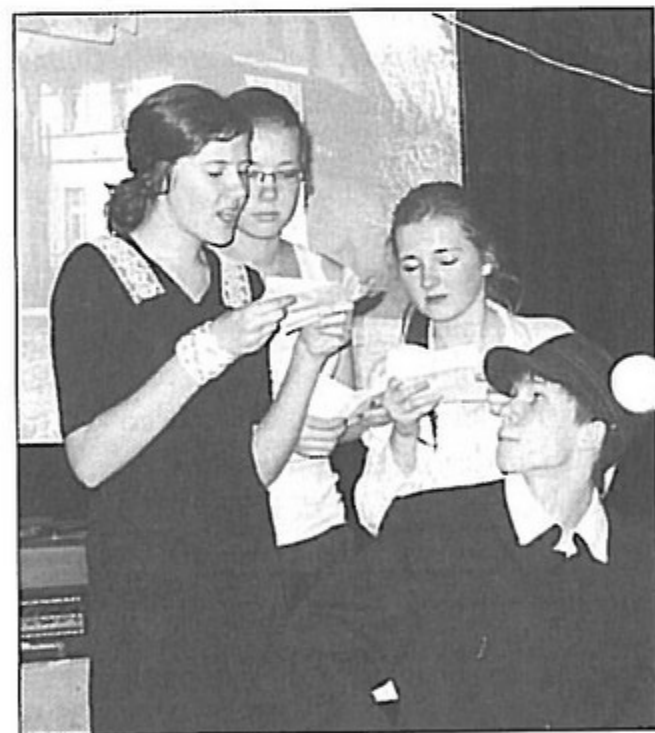
Gimnazjaliści przedstawili spektakl oparty na legendzie Pawłowic.

Prezentacje odbywały się równocześnie w kilku szkolnych salach. Największe wrażenie wywarła legenda Pawłowic. Czworko uczniów postanowiło pod