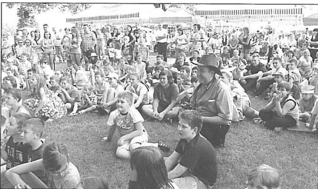
Takich tłumów na festynie parafialnym jeszcze nie było!