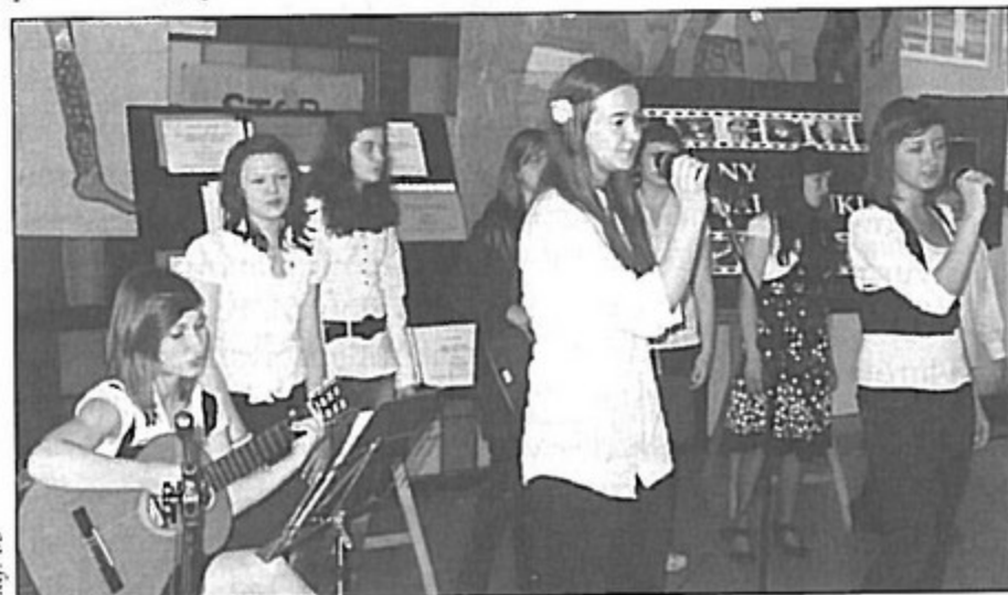
Młodzież przygotowała występy artystyczne.