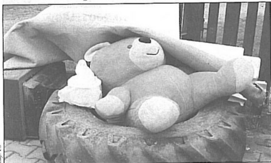
Na śmietnik trafiły meble, opony i duży miś.

Już 10 lat minęło od wprowadzenia zbiórki odpadów segregowanych w naszej gminie. Jako jedni z pierwszych w województwie, bo już w 2000 roku pawłowiczanie zaczęli segregować szkło, plastik i papier.