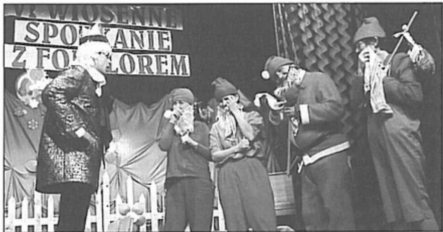
Spektakl w wykonaniu nauczycieli zachwyił uczniów.