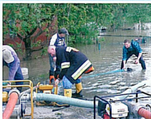
KRZYŻOWICE - skrzyżowanie ulic Śląskiej i Zwycięstwa

Woda wdarła się do kilkudziesięciu domów, strażacy ewakuowali ludzi, zwierzęta, wywozili zbiory paszy. Potężne ulewy załwały Pawłowice, Pielgrzymowice, Krzyżowice i Pniówek. Czytaj na str. 2-7