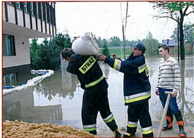
Strażacy pomagali przy budowaniu wałów w dzień i w nocy.