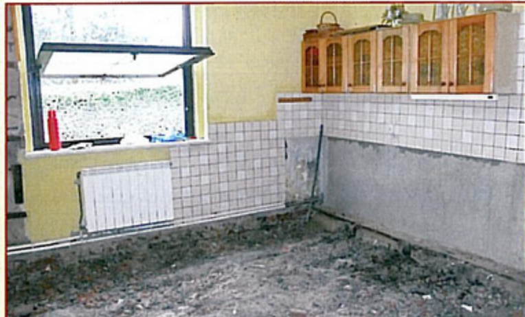
Jedno z zalanych mieszkań przy ulicy Wyzwolenia w Pawłowicach.