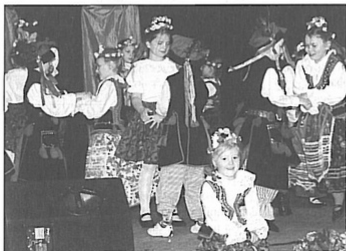
Każda szkoła przygotowała wspaniały występ.