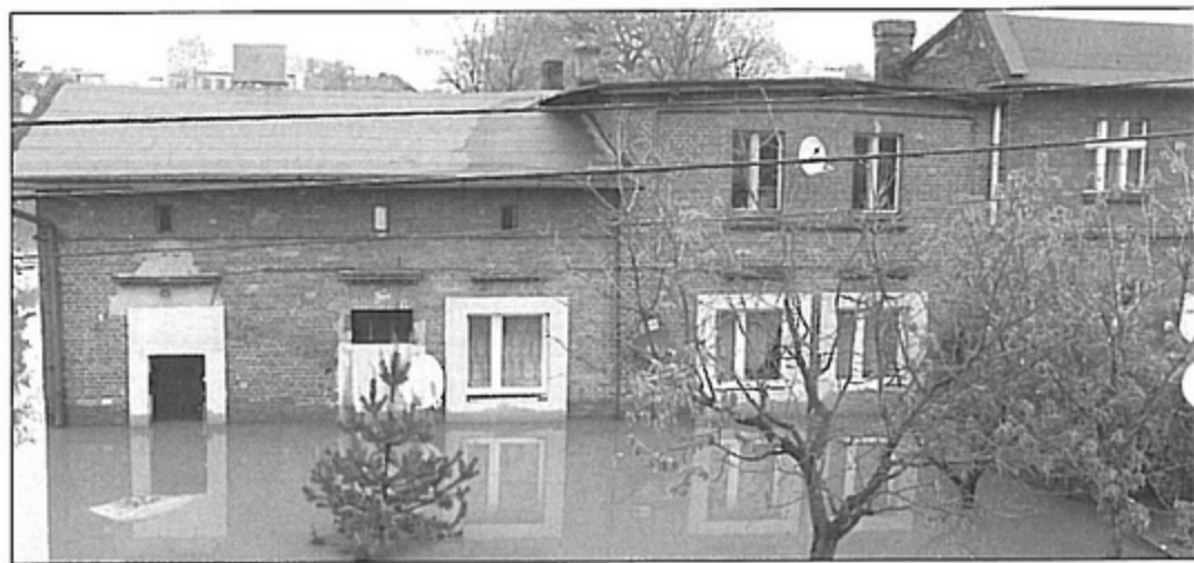
Jedna z posesji przy ulicy Zwycięstwa w Krzyżowicach, z której ewakuowano sześciuosobową rodzinę.