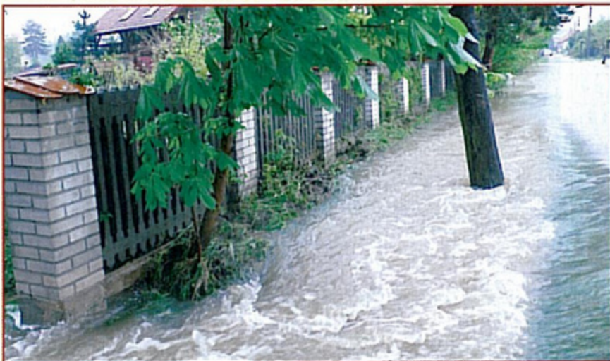
Wiele dróg na terenie naszej gminy przypominało wezbrane potoki.