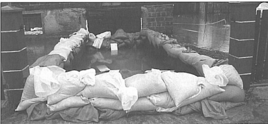
Mieszkańcy pompowali wodę i układali worki z piaskiem, żeby ratować zagrożone posesje.