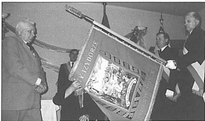
Uroczyste nadanie sztandaru - pierwszy z lewej to prezes Kółka Rolniczego.

Dodatkowo prezes Kółka Rolniczego otrzymał statuetkę „Złotego Kółkowicza” nadaną przez Zarząd Wojewódzkiego Związku Rolników, Kółek i Organizacji Rolniczych. bs