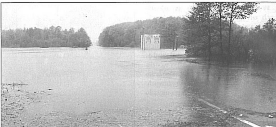
Prace przy usuwaniu wody zalegającej na trasie Pawłowice – Jastrzębie potrwać jeszcze kilka dni.

Kilka dni wcześniej, woda wdarła się do domów przy ul. Pszczyńskiej (od strony Jastrzębia). Mieszkańcy z zagrożonego terenu opuszczali w pośpiechu swoje domy i udali się do swoich rodzin. – Parter mojego domu