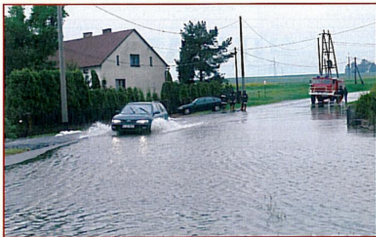
Przez ulicę Ligonja w Krzyżowicach niektórzy próbowali przejeżdżać samochodem.