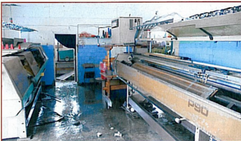
Hala zakładu odzieżowego przy ulicy Zwycięstwa w Krzyżowicach, dzień po zejściu wody.