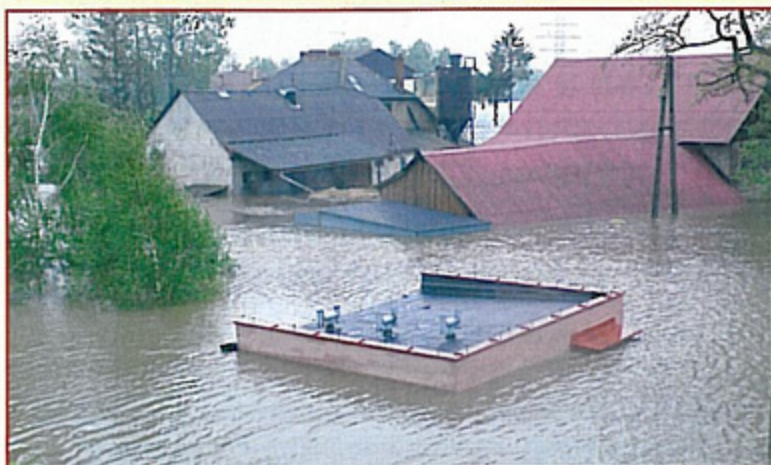
Zalane gospodarstwo przy ulicy Zwycięstwa w Krzyżowicach.