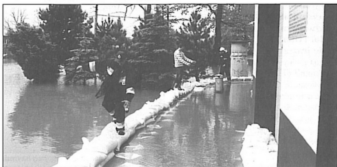
Walka o to, by nie zalano budynku OSP w Krzyżowicach trwała 24 godziny na dobę.

Prawdziwy dramat przeżyli mieszkańcy ul. Zwycięstwa, którzy do ostatniej chwili modlili się o cud i wierzyli, że ich dom nie zostanie zalany. – Kiedy zorientowaliśmy się, że