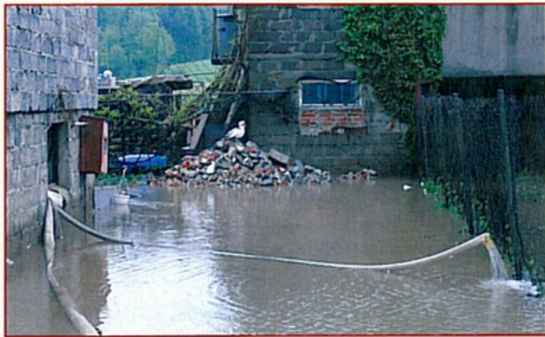
Tak wyglądała 18 maja posesja przy ulicy Karola Miarki w Pielgrzymowicach.