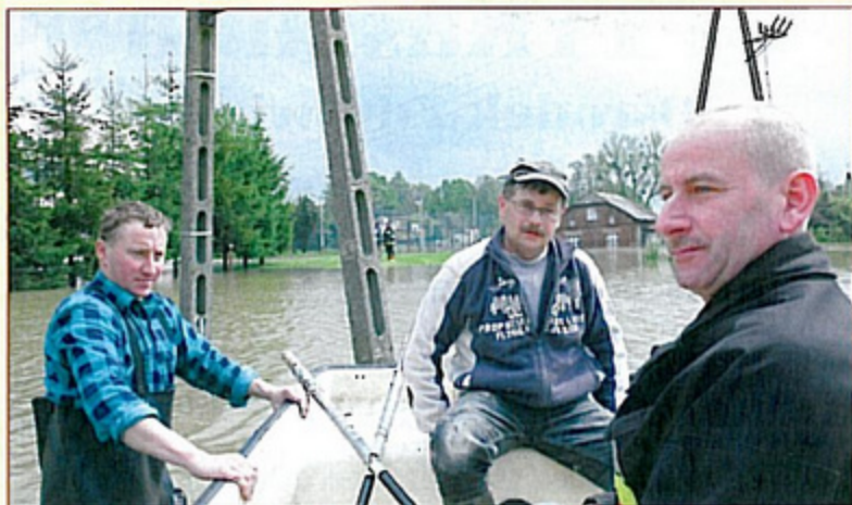
W wielu miejscach strażacy musieli poruszać się łódkami.