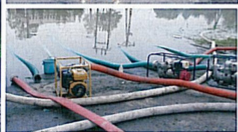
PIELGRZYMOWICE - ul. Karola Miarki