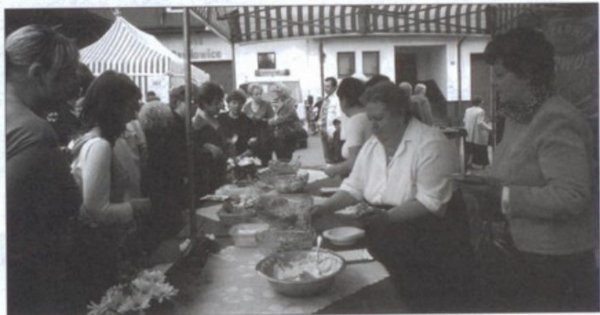
Panie z KGW w Pniówku przygotowały pyszne salatkę, które za darmo serwowały w czasie Dnia Promocji Zdrowia.

Duże wrażenie na publiczności wywarły także nasze pawłowickie gwiazdy. Zespół „Miniatura” i grupa wokalna „Miraż” to już klasa sama w sobie i najwyższy poziom.