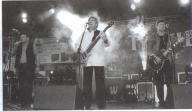
Dla najmłodszych największą frajdą był plac zabaw z karuzelami, a dla tych starszych - koncert zespołu "Skaldowie".

W sobotę teren parku należał do Gminnego Ośrodka Sportu, który dla wszystkich chętnych zorganizował „bieg na orientację”, zawody w biegu na 2 kilometry oraz turniej ringo i siłowanie się na rękę. Następnego dnia sportowcy ustąpili miejsca biesiadnikom, a mieszkańcy Pawłowic wysłuchali orkiestry dętej KWK Pniówek, odpoczywali w cieniu drzew oraz bawili się razem z zespołem „Duo Vocal & Sax”.