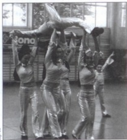
Najmłodsza grupa Flavy dała prawdziwe show.

Pełne żywiołowości występy sprawiły, że festiwal ogłądało się z prawdziwą przyjemnością. bs