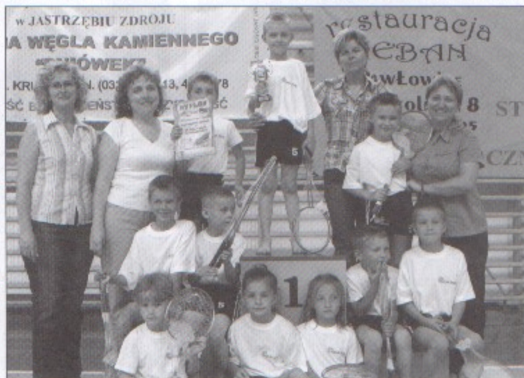
Przedszkolaki z Pawłowic – zwycięzcy olimpiady.

a wszystkie dzieci uczestniczące w rywalizacji oraz kibicujące swoim kolegom – słodycze i napoje. Nagrodami w olimpiadzie były bony od 400 do 250 zł przeznaczone na dofinansowanie wybranego przez dzieci wyjazdu. bs