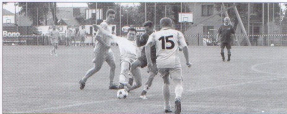
Urzednicy grali z poświęceniem i pasją.

Odmłodzona drużyna urzędników solidnie przygotowała się do tego spotkania