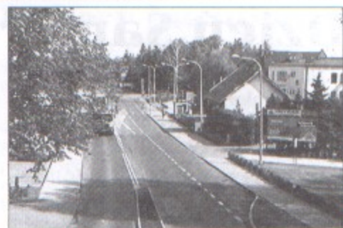
zob. z monitoringu

Monitoring Pawłowic to, obok dodatkowych patroli pieszych, kolejne wspólne dzia-