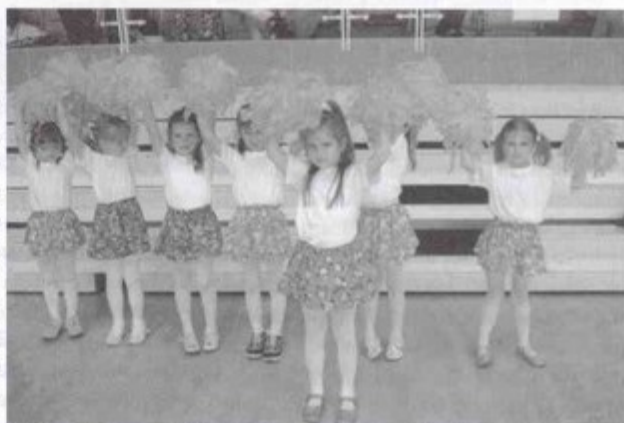
Male cheerleaderki z Przedszkola nr 1 w Pawłowicach.