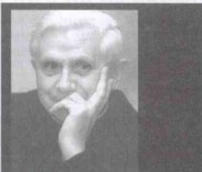
Kardynał Joseph Ratzinger

W bibliotekach publicznych naszej gminy jest wiele publikacji tego Niezwykłego Człowieka. Są to m.in. następujące publikacje: „Służyć prawdzie”, „Pielgrzymująca wspólnota wiary”, „W drodze do Jezusa Chrystusa” oraz „Wielość religii i jedno Przymierze”, a także „Wiara, prawda i tolerancja”.