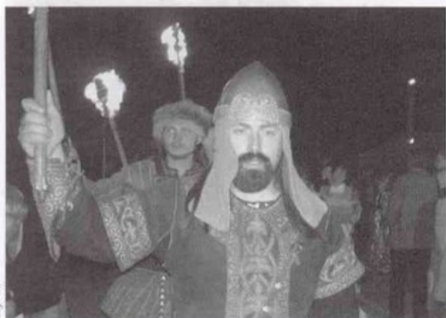
W orszaku rycerzy z pochodniami list z życzeniami dla Pawłowic został przeniesiony do parku.