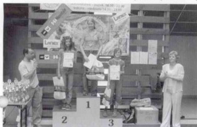
Podium dziewczyn w kat. 13 - 14 lat.

Trzynasty nie okazał się pechowy. 13 maja w hali Gminnego Ośrodka Sportu w Pawłowicach odbyła się ostatnia edycja tegorocznego Pucharu Czterech Ścianek. Impreza ta jest owocem współpracy czterech ośrodków sportowych: w Brzeszczach, Bielsku-Białej, Jastrzębiu Zdroju i Pawłowicach, gdzie mali wspinacze pod okiem swych instruktorów uczyli się trudnej sztuki wspinaczki ściankowej.