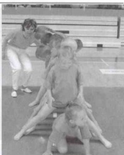
Przedszkolaki z Golasowic zajęły III miejsce.

W tym samym czasie w szkole w Pielgrzymowicach odbyły się II Międzyszkolne