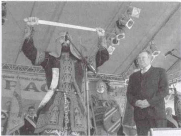
6 Racje Gminne

Miecz od przodka Pawłowic dla wójta gminy.