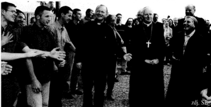
Podopieczni Wspólnoty najpierw uczestniczyli we Mszy świętej