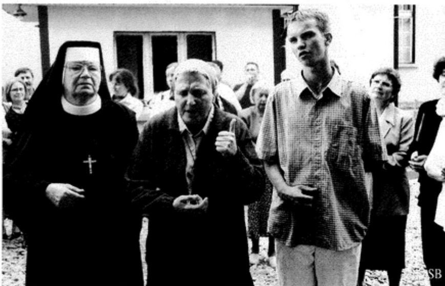
Radość z przybycia do domu arcybiskupa okazano gestem i śpiewem