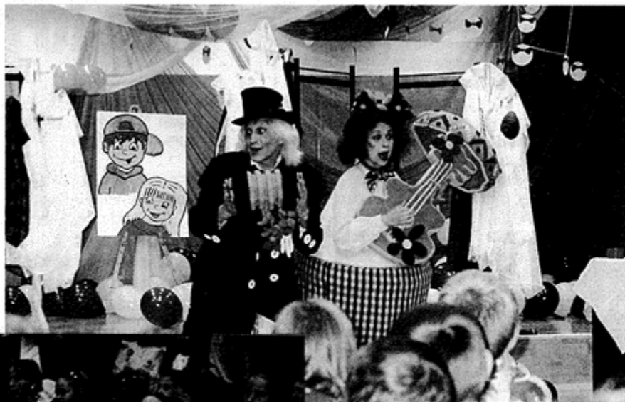
Przedstawienie „Happening” teatru „Biały Klaun”