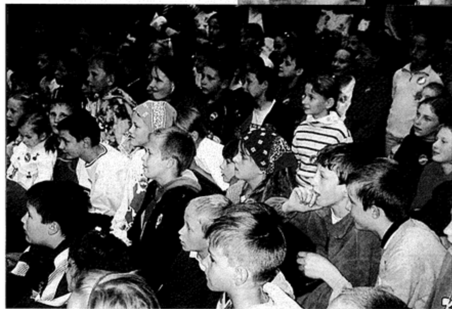
Aktorzy potrafili przykuć uwagę młodych widzów

rencjach: jeździły na workach, rysowały kolorową kredą, rzucały piłeczkami do tarczy, zmierzyły się w pojedynkach szachowych i sprawdziły swoją czytelną pamięć w Bibliotece.