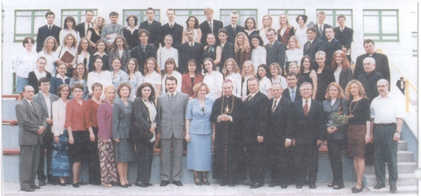
Rodzinna, pamiątkowa fotografia uczniów i przyjaciół szkoły

Podobno najmądrzejszy - w sensie posiadanej wiedzy książkowej - jest człowiek w czasie matury. Któż nie wspomina z łezką w oku czasów spędzonych w szkole.