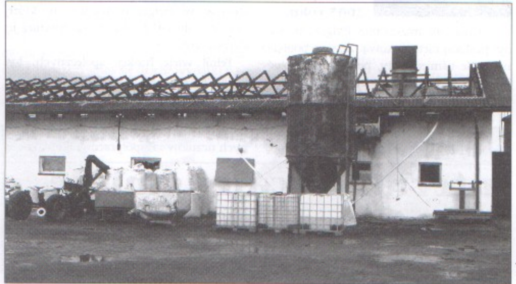
W pożarze spaliła się konstrukcja i pokrycie dachu kurnika.