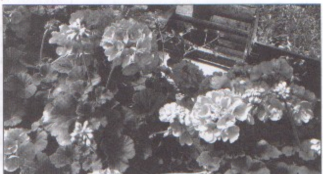
Kwiaty pelargonii o miękkich płatkach we wszystkich odcieniach różu, czerwieni i bieli potrafią kwitnąć nieustannie całe lato.