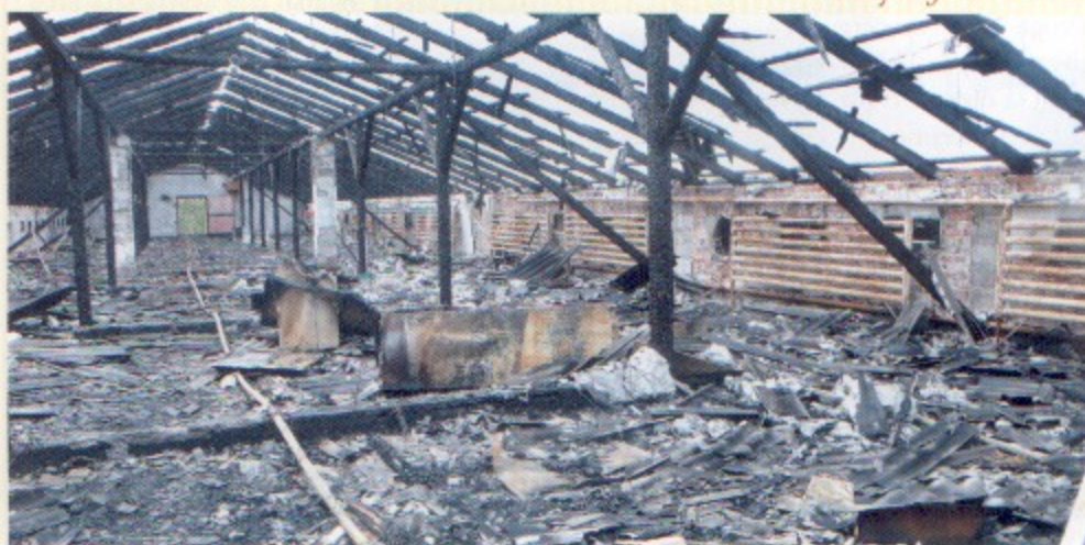
Piętro budynku spłonęło doszczętnie.