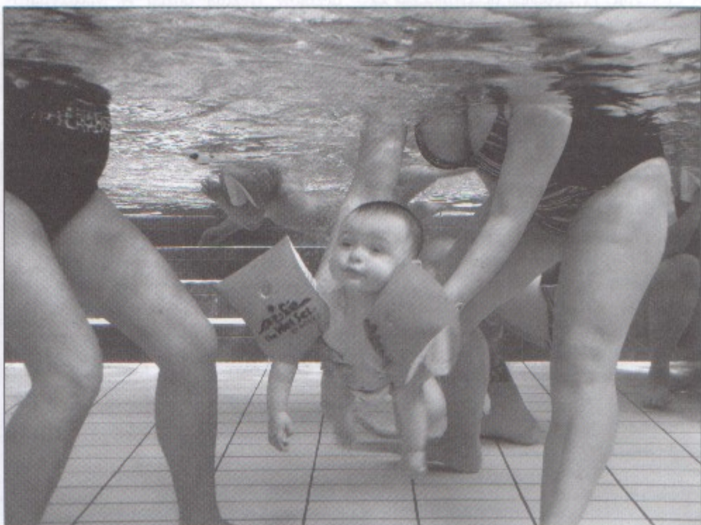
Egzamin z nurkowania ten maluch przeszedł z łatwością.

Więcej na temat zalet pływania oraz fotograficzne relacje z nurkowania paluszków można znaleźć na stronie www.plywanieszkrabow.pl w galeriach zdjęć. A.K.