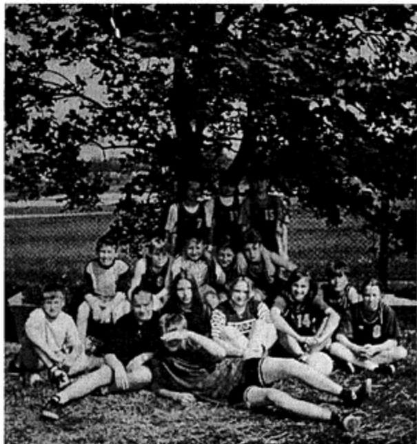
Pamiątkowe zdjęcie zwycięzców z Pawłowic

Impreza obejmowała kilka faz- przede wszystkim jednak zawody z jednym konkursem teoretycznym (z zakresu wiedzy o obronie cywilnej), z konkursem udzielania praktycznej pomocy, sześć sprawności sportowych, pokaz ratownictwa ekologicznego (tu popisali