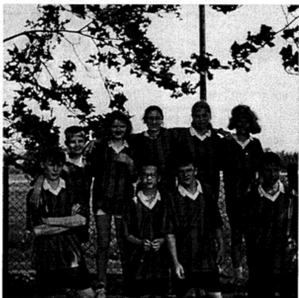
Krzyżowice: Drugie to... prawie pierwsze

Było tego, a było! Dla młodych sama radocha, choć nie tylko, nie tylko! Przychodziło też zdrowo główkować przy odpowiadaniu na