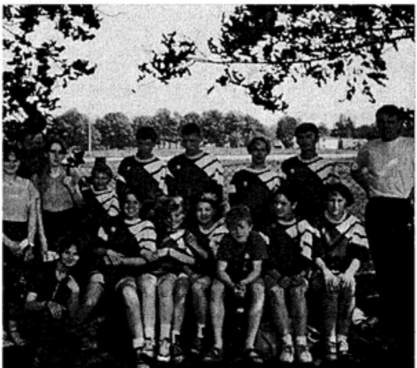
Honorowa trzecia pozycja dla Golasowic, ubiegłorocznej zdobywczyni pucharu