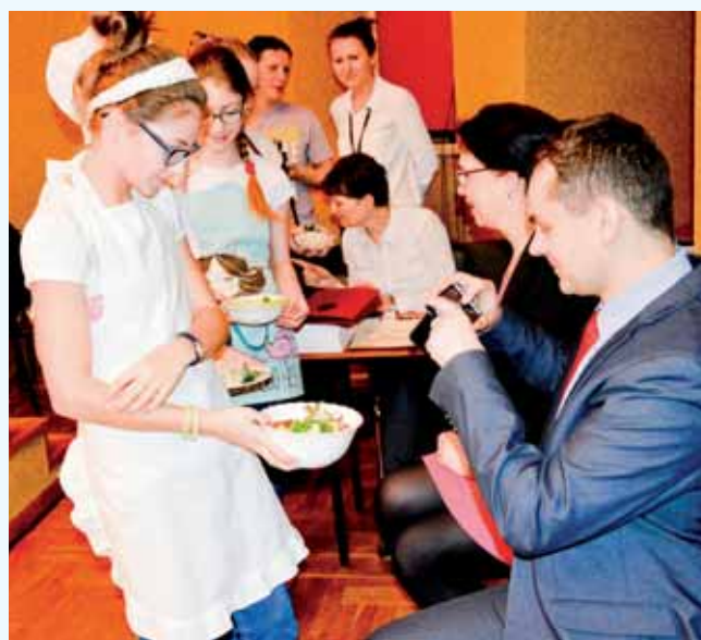
Umiejętności kulinarne uczennic wzbudziły zachwyt publiczności.