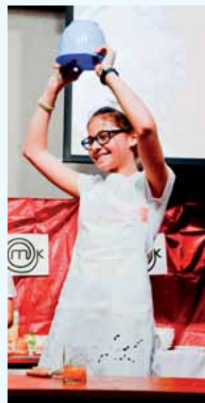
Jedną z konkurencji było ubijanie piany z białek na czas.