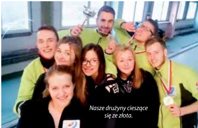
Nasze drużyny cieszące się ze złota.