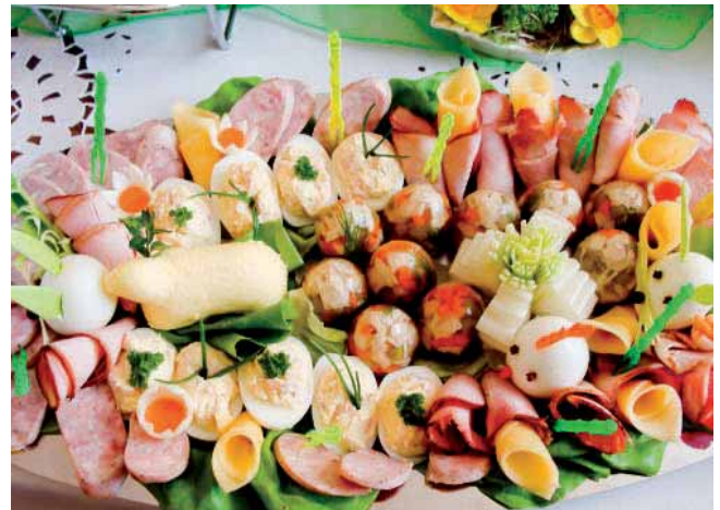
Takie specjalności na konkurs przygotowały członkinie KGW w Jarząbkowicach.