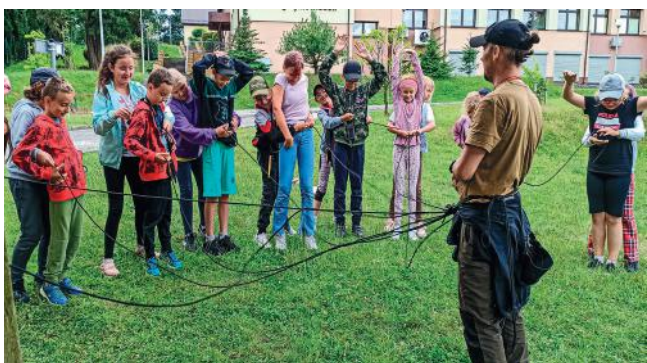
fol. GBP Filia Pielgrzymowice

Różnorodne warsztaty dla młodych czytelników przygotowała Gminna Biblioteka Publiczna. W Filii Osiedle podczas trzech dni pełnych wrażeń dzieci poznały dwie urocze alpaki, nauczyły się robić zdrowe i pożywne desery, wzięły też udział w detektywistycznej grze terenowej.