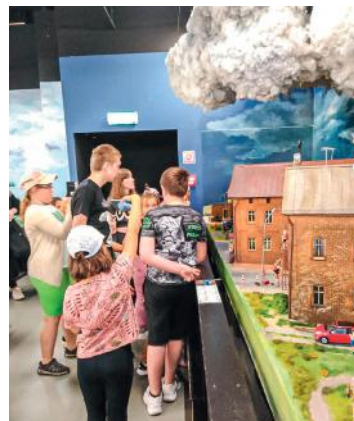
fol. OPS Pawłowice

W świetlicy „Różowe Okulary” zawsze wiele się dzieje, także w czasie wakacji. Celem jednej z wycieczek było Kolejkowo w Gliwicach, gdzie można podziwiać miniatury autentycznych budowli ze Śląska i nie tylko. Dzieci wyjechały też do parku wodnego, a w planach są już kolejne wycieczki i inne atrakcje. Szczegóły pod numerami tel.: 32 4721741 lub 739 001 606.