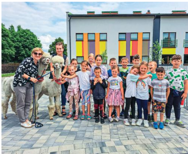
fol. GBP Filia Osiedle

Latem dzieci z gminy Pawłowice mają na miejscu tyle atrakcji, że o nudzie nie ma mowy.