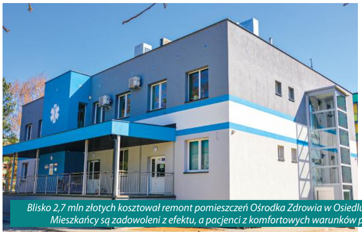
Blisko 2,7 mln złotych kosztował remont pomieszczeń Ośrodka Zdrowia w Osiedlu Pawłowice. Mieszkańcy są zadowoleni z efektu, a pacjenci z komfortowych warunków przyjęć.