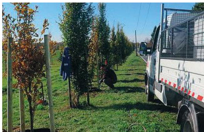
zdj. UG Pawłowice