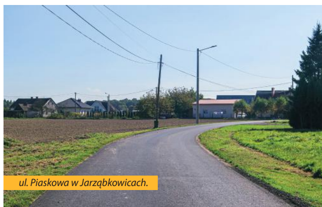
ul. Piaskowa w Jarząbkowicach.

Gmina podpisała umowę na kolejne prace w tym zakresie i w najbliższym czasie nakładki zostaną wykonane na prawie kilometrowym odcinku w Pielgrzymowicach oraz na terenie parkingu przy szkole