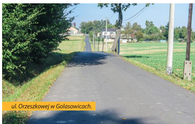
ul. Orzeszkowej w Golasowicach.