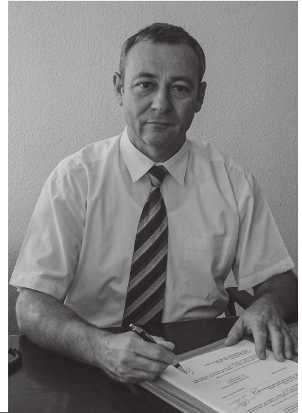
zdj. UG Pawłowice