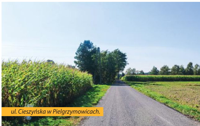
ul. Cieszyńska w Pielgrzymowicach.