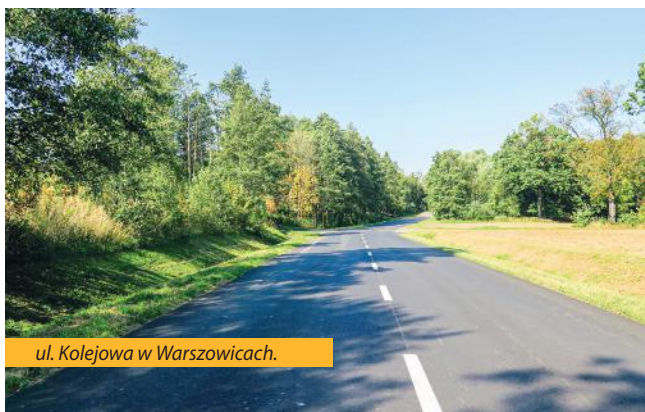
ul. Kolejowa w Warszowicach.