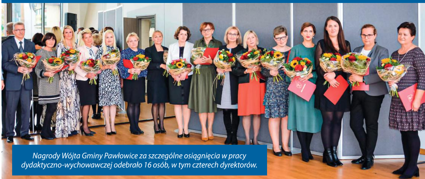
Nagrody Wójta Gminy Pawłowice za szczególne osiągnięcia w pracy dydaktyczno-wychowawczej odebrało 16 osób, w tym czterech dyrektorów.