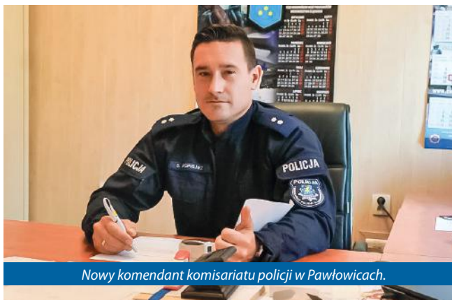
Nowy komendant komisariatu policji w Pawłowicach.