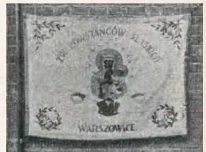
Sztandar powstańców śląskich z Warszawy w czasie II wojny światowej

W okresie dwudziestolecia międzywojennego Zarząd Główny Związku Powstańców Śląskich był wydawcą miesięcznika „Powstaniec Śląski”, na jego łamach ukazały się m.in. artykuły i fotografie dotyczące trzech powstań. Przegląd archiwalnych numerów „Powstańca Śląskiego” może być źródłem wiedzy o walce oraz drodze Górnolązaków do odrodzonej Rzeczypospolitej.