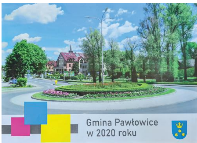
Gmina Pawłowice w 2020 roku

Publikacja powstała na podstawie raportu o stanie Gminy Pawłowice za rok 2020. To dokument podsumowujący roczną działalność wójta oraz realizację uchwał rady gminy. Dokument został przygotowany w oparciu o ubiegłoroczne dane dotyczące różnych obszarów funkcjonowania gminy: budżetu, inwestycji, ochrony środowiska, oświaty, gminnego wsparcia dla utalentowanych uczniów i sportowców, stanu majątkowego gminy, pomocy dla potrzebujących itd. Przygotowanie raportu jest ustawowym obowiązkiem wójta.