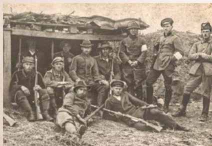
Grupa powstańców pod Olzą uzbrojona w karabiny Mannlicher i granaty trzonkowe

Wobec spóźnionego zajęcia Januszkowic i braku łączności z formacjami pułku Kościuszki, oddziały niemieckie zamierzały natychmiast po utracie przez nich Krasowy, przedostać się na tyły baonu III., przypuszczając szturm z lewego skrzydła na Krasowę. Zostały jednak z wielkimi stratami odparte ogniem naszych karabinów maszynowych. Przez całą noc baon stał na zajętych pozycjach nie mając łączności z lewego skrzydła.