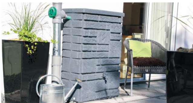
Dofinansowanie można uzyskać na zakup, montaż, budowę i uruchomienie instalacji pozwalającej na zagospodarowanie deszczówki i wód roztopowych na terenie nieruchomości.

i Narodowy Fundusz Ochrony Środowiska i Gospodarki Wodnej Program Moja Woda będzie realizowany w latach 2020–2024, przy czym podpisywanie umów o dotację zaplanowano do 30 czerwca 2024 r., a wydatkowanie środków do końca 2024 r. Budżet całego programu to 100 mln zł, co pozwoli na sfinansowanie aż 20 tys. instalacji przydomowej retencji i zatrzymanie 1 mln metrów sześciennych wody rocznie.